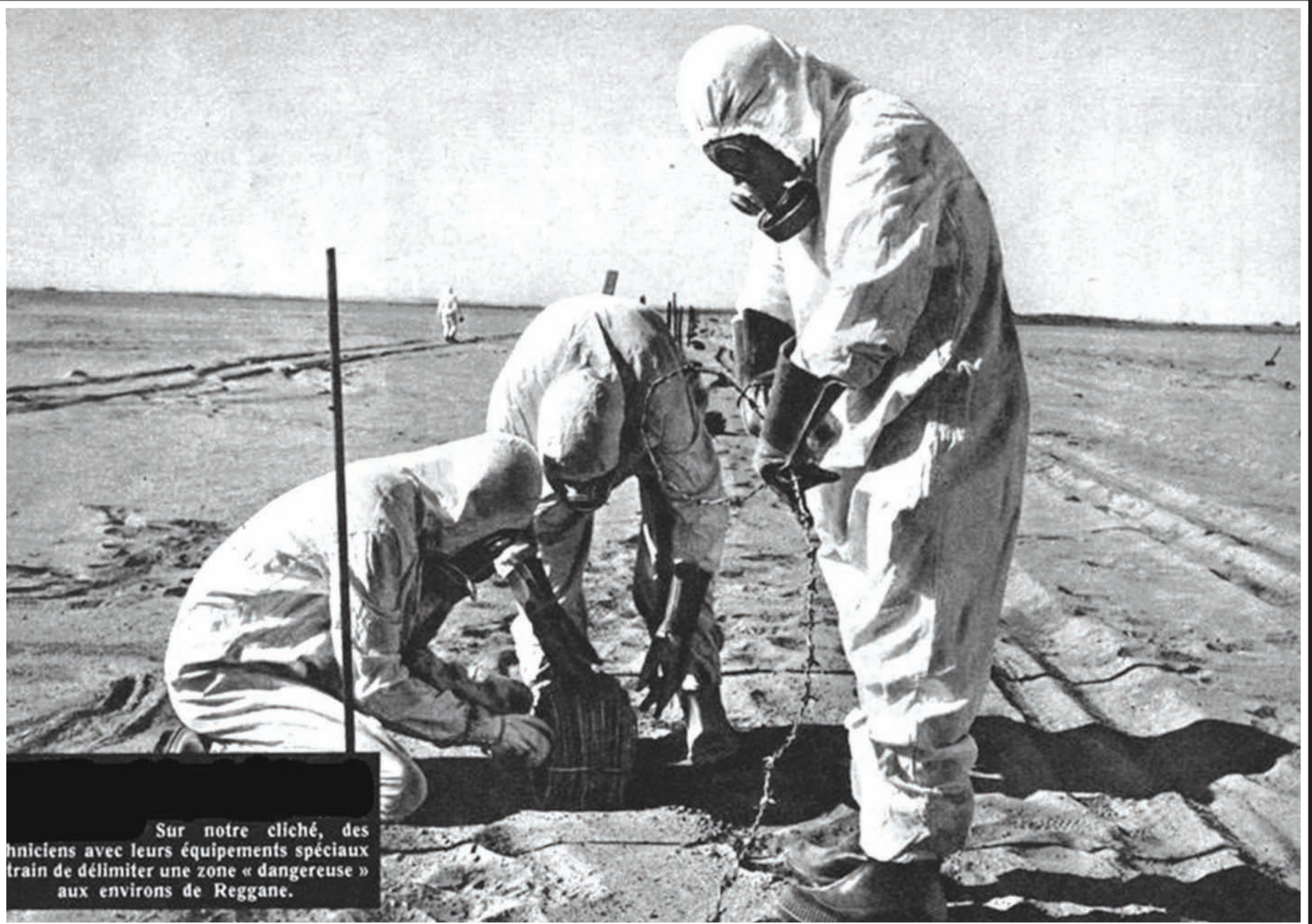
Sur notre cliché, des techniciens avec leurs équipements spéciaux trainent de délimiter une zone « dangereuse » aux environs de Reggane.