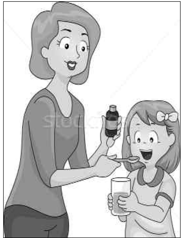
délivrés sans ordonnance.

S'auto-administrer un traitement antérieurement prescrit peut être dangereux. La seule automédication acceptable s'applique à des affections bénignes que l'on traite avec des médicaments