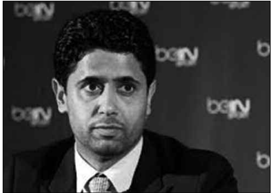
L'arrivée de ces deux hommes au Qatar, 24 heures après l'annonce de l'ouverture de l'enquête, prouve qu'Al-Khelaïfi compte préparer sa contre-attaque

Il avait défendu les intérêts du Qatar dans sa plainte en diffamation contre Florian Philippot en 2015 et aussi Jacques Chirac par le passé.