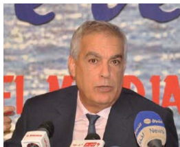
PH. K. REICARD