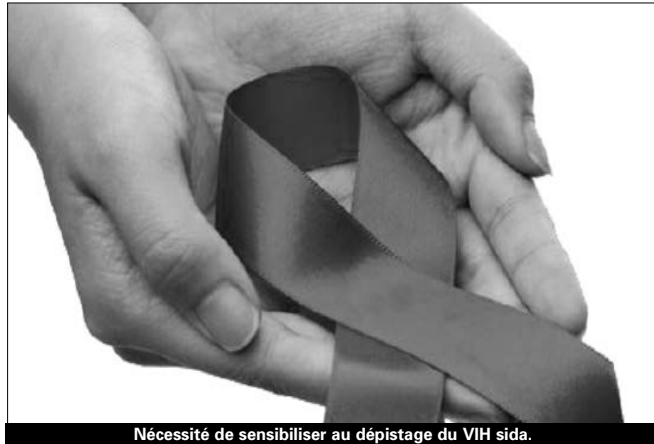
Nécessité de sensibiliser au dépistage du VIH sida.

Les associations activant dans le domaine de la solidarité et de la lutte contre le sida "n'ont pas les techniques nécessaires pour encourager les populations fragiles à