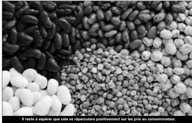
Il reste à espérer que cela se répercutera positivement sur les prix au consommateur.

La superficie actuelle (85.000 ha) affectée aux légumineuses permet de produire