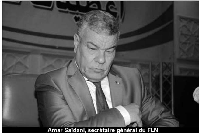
Amar Saïdani, secrétaire général du FLN

Le secrétaire général, Amar Saïdani, fait ainsi face à une nouvelle fronde. Lui qui croyait pourtant avoir réduit au silence ses détracteurs emmenés par son prédécesseur, Abdelaziz Belkhadem, est confronté de nouveau à la contestation. Ainsi en sus du refus de larges pans de militants et cadres de la restructuration organique à travers la création de nouvelles mouhafadhas, la contestation a aussi gagné les rangs des députés de l'Assemblée populaire nationale (APN). Des dizaines de députés, appuyés semble-t-il par des membres du comité central, s'approprieraient à monter au créneau et faire part de leur opposition ouverte à Amar Saïdani. Cette nouvelle fronde a pour objectif la destitution du secrétaire général du FLN et l'élection d'un nouveau secrétaire général. Amar Saïdani est suspecté, afin de rester à la tête du parti, de programmer un congrès « sur mesure » afin de demeurer à son poste pour un mandat de cinq années. Selon certaines indiscrétions c'est le ministre de la Justice, garde des Sceaux, Tayeb Louh, qui serait le principal instigateur de cette nouvelle fronde. A cette fronde Saïdani ferait aussi face à la grogne qui se fait entendre de plus en plus au sein de la base militante. Il y a juste quelques jours des dizaines de militants et cadres, dont certains membres du comité cen-