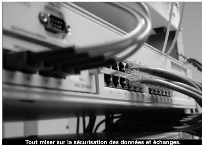
Tout miser sur la sécurisation des données et échanges.

Cette résolution vise "l'établissement de relations de coopération internationale de haut niveau sous la présidence de l'UIT permettant d'évaluer les risques potentiels sur la sécurité nationale et internationale en utilisant ces technolo-