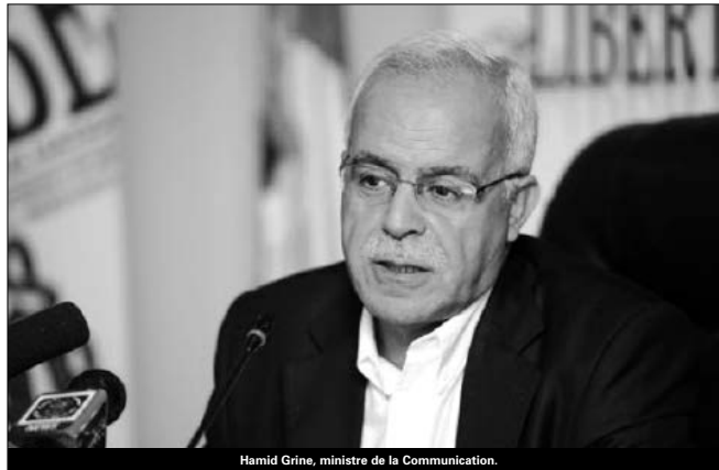
Hamid Grine, ministre de la Communication.

A ce titre, Hamid Grine a fait part, en attendant l'entrée en service de l'imprimerie de presse de Tamanrasset, de la