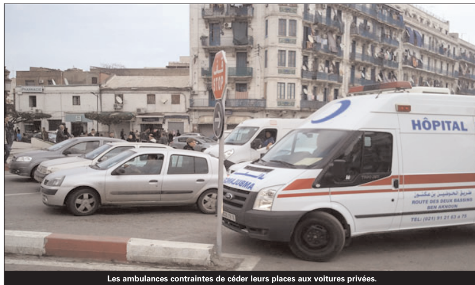
Les ambulances contraintes de céder leurs places aux voitures privées.

Les gestionnaires des CHU d'Alger se plaignent des superficies réduites réservées au parking au sein de ces établissements, qui ne peuvent accueillir les véhicules des personnels des hôpitaux ou ceux des proches des patients, outre le problème des embouteillages. Le CHU Mustapha Pacha vient en tête de ces établissements, car ses quatre entrées connaissent un grand encombrement. Le nombre de véhicules qui y accèdent quotidiennement avoisine les 3000 voitures, bloquant ainsi la voie au niveau de l'entrée principale de l'hôpital et amenuisant les chances de trouver une place de parking pour le personnel de l'hôpital ou les proches des patients, a indiqué à l'APS le directeur général de cet établissement, Hachemi Chaouch. Cet hôpital a été bâti à l'époque coloniale pour accueillir 400 véhicules seulement mais aujourd'hui celui-ci accueille près de 3000 véhicules, se transformant ainsi en un grand parking occupé par le personnel du CHU et celui du Centre de cancérologie Pierre et Marie Curie (CPMC), outre les véhicules des patients venus d'Alger et de sa banlieue et des visiteurs, a-t-il précisé. Ce CHU assure la formation de plus de 1000 médecins résidents, car disposant du plus grand nombre de services à Alger, outre les 11 services d'urgences spécialisés accueillant chacun près de 300 patients/jour, assurant ainsi davantage d'opportunités dans les domaines de la formation et de