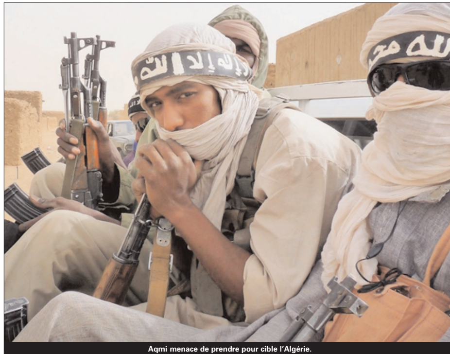
Aqmi menace de prendre pour cible l'Algérie.

En effet, dans son nouveau communiqué intitulé la « Moisson du mois », Aqmi a promet de cibler l'Algérie et uniquement l'Algérie, bien entendu en évitant de parler du Maroc, à travers des actions armées, notamment des attaques-suicides d'autant que, explique le communiqué des islamistes armés, l'Algérie est un ennemi qui date depuis la nuit des temps. Pourquoi l'Algérie ? Comment peut-on alors expliquer les attentats terroristes ayant frappé la Tunisie et la Libye ? Pourquoi le Maroc est plutôt protégé par les actions d'Aqmi ? Pour Aqmi, l'Algérie est un pays important, car il s'agit d'une force régionale, non seule-