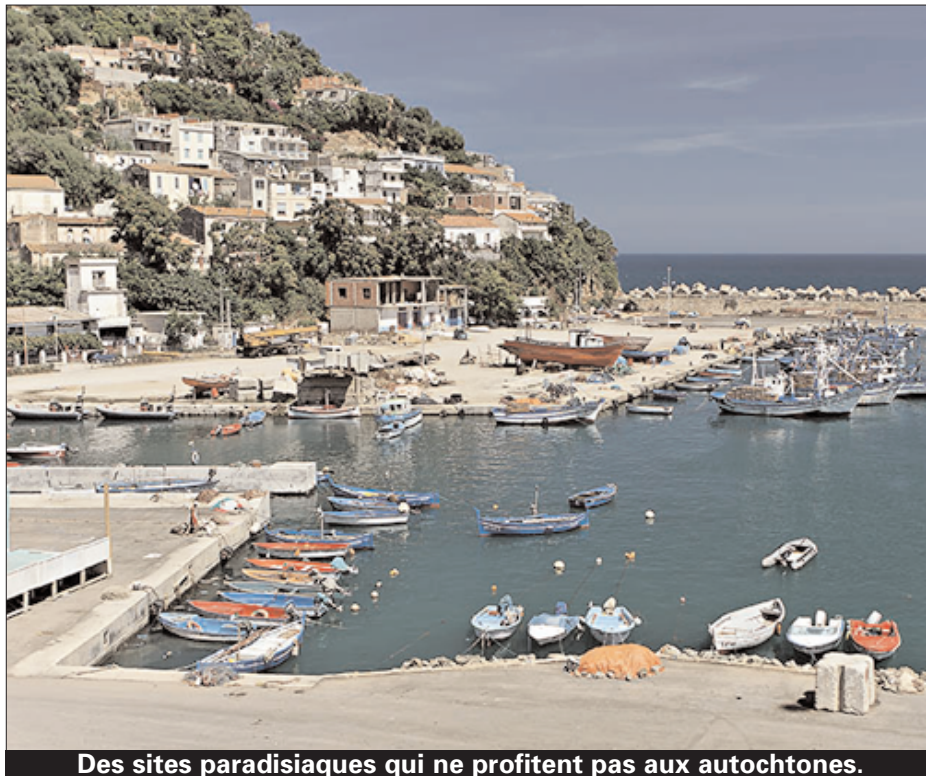
Des sites paradisiaques qui ne profitent pas aux autochtones.

Un autre handicap réside dans la cherté des billets d'avion même si la compagnie nationale Air Algérie a réduit de 50% les tarifs pour les destinations du Sud. Du reste, les vacanciers n'ont que l'option des plages en saison estivale avec cependant un rush qui témoigne d'un goût plus prononcé pour la villégiature balnéaire que pour d'autres genres touristiques. Pourtant les dernières déclarations du ministre du Tourisme, Mohamed Benmerradi, sont rassurantes. A l'en croire, le tourisme interne devient une priorité avec des résultats chiffrés. Près de 4 millions de curistes pour cette année. L'année dernière, les résultats de l'Onat