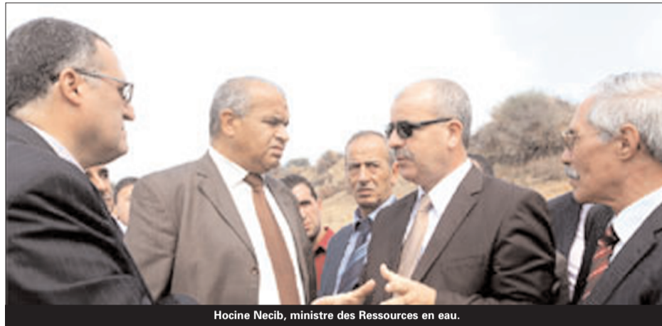
Hocine Necib, ministre des Ressources en eau.

A u cours d'une séance de travail présidée en clôture de sa visite de travail dans cette wilaya, M. Necib a affirmé que le déficit enregistré dans la concrétisation des