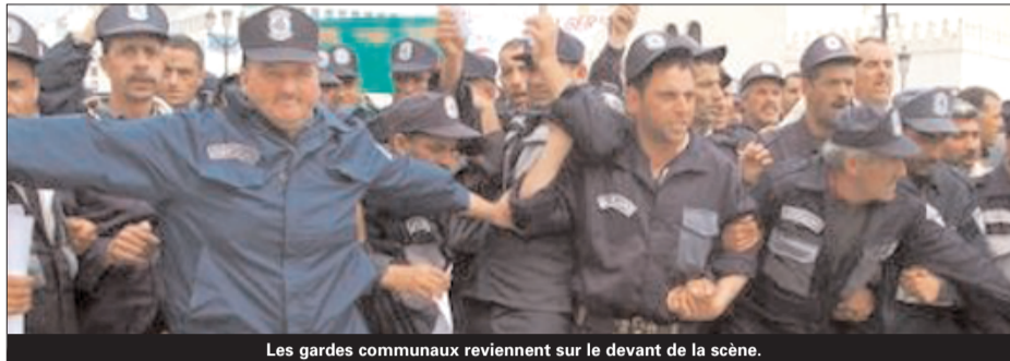
Les gardes communaux reviennent sur le devant de la scène.

Leur coordination nationale menace même d'organiser une action d'envergure nationale, dont ni la date ni le lieu n'ont encore été précisés si, bien sûr, leurs revendications ne sont pas prises en compte par le ministère de l'Intérieur et des Collectivités locales. En somme on s'achemine vers un nouveau bras de fer entre les gardes communaux et le ministère de l'Intérieur. Un bras de fer qui dure depuis quelques années déjà et l'on se rappelle, à ce titre, la grande manifestation organisée à Alger ainsi que la fameuse marche de Blida en direction de la capitale qui a vu la participation de milliers de personnes. C'est dans ce contexte de tension que le ministère de l'Intérieur, qui soutient mordicus que le dossier est clos puisque toutes les revendica-