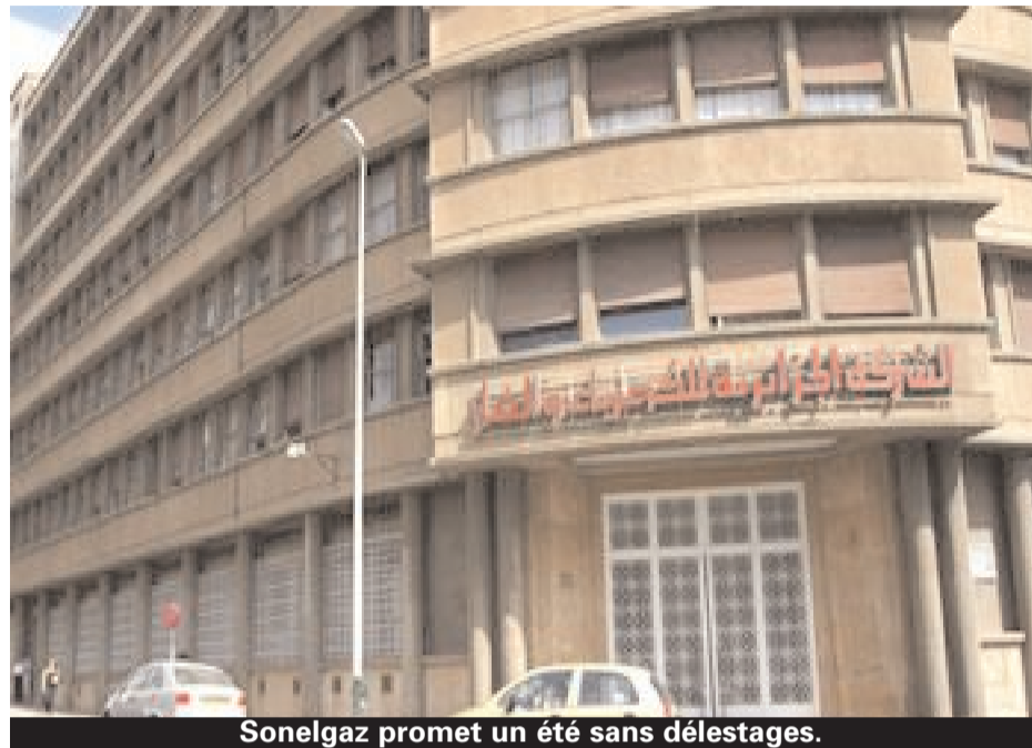
Sonelgaz promet un été sans délestages.

La mise en exécution de ce plan d'urgence s'inscrit dans le but de satisfaire la demande nationale, notamment