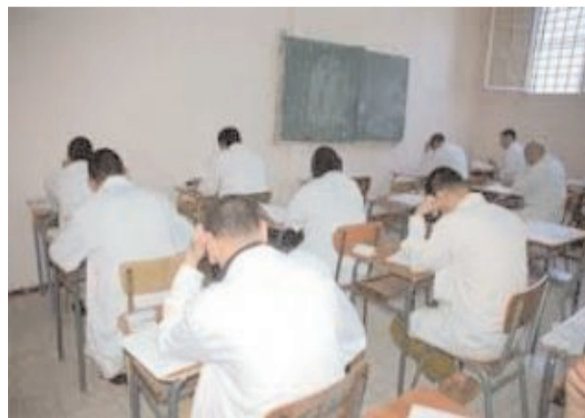
378 détenus candidats aux épreuves du BEM, suivi du centre de "Boussouf" à Constantine (253 candidats) et du centre de Bordj Bou-Arredj (253 candidats).