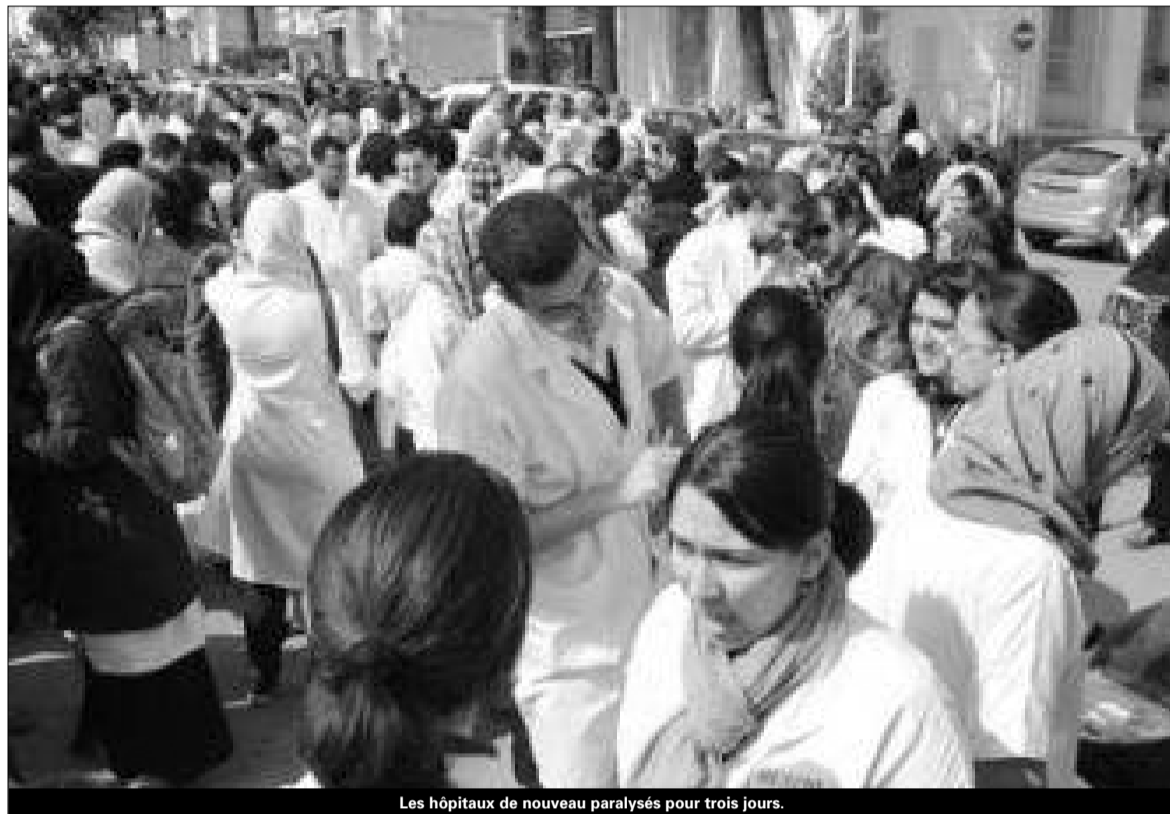
Les hôpitaux de nouveau paralysés pour trois jours.

Même constat dans le centre hospitalo-universitaire du Pr Nafissa-Hamoud à