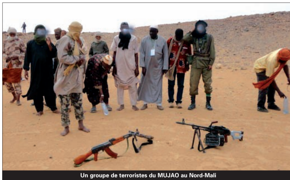
Un groupe de terroristes du MUJAO au Nord-Mali

En effet, selon le porte-parole et mufti du MUJAO, le siège du consulat d'Algérie à Gao a été pris par les combattants de son mouvement, car le siège en question étant le plus grand dans la ville de Gao et le plus près du centre-ville et du souk (marché). Donc, c'est un lieu stratégique qualifié de très important par les terroristes du MUJAO. Ces derniers ont déjà installé leur drapeau noir, sur lequel un slogan est écrit : «La ilaha ila Allah Mohamed Rassoul Allah», juste devant l'entrée principale du siège du consulat d'Algérie. En investissant le siège, les terroristes ont brûlé les livres appartenant au consulat d'Algérie, parmi lesquels figurent ceux du Cheikh Ibn Badis, explique l'un des terroristes du MUJAO à une source mauritanienne. Ce terroriste est d'origine algérienne, pis, avant de rejoindre les rangs du MUJAO, il exerçait comme agent de sécurité au sein du consulat d'Algérie à Gao. Natif du Sud algérien, ce terroriste, armé d'un kalachnikov et une ceinture d'explosifs, a expliqué que les Algériens s'ils étaient de