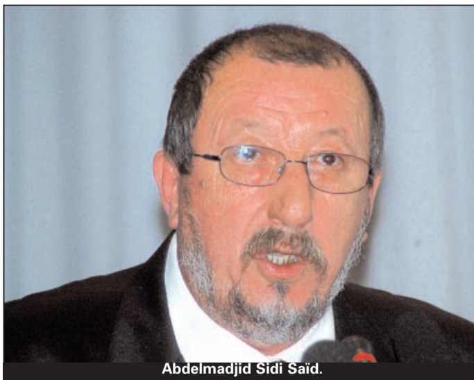
Abdelmadjid Sidi Saïd.

La centrale syndicale a rappelé quelques acquis arrachés ces dernières années comme «la création du Fonds national des réserves de retraites, l'indemnité complémentaire des pensions, le relèvement et l'amélioration de la majoration pour conjoint à charge, l'exonération de l'impôt sur