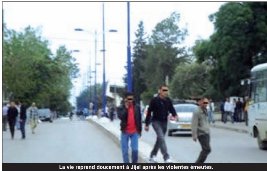
La vie reprend doucement à Jijel après les violentes émeutes.

Fin de semaine mouvementée également à Ghardaïa où des échauffourées sporadiques ont éclaté dans la nuit de jeudi à vendredi entre des jeunes de deux quartiers à la limite administrative entre les communes de Ghardaïa et Bounoura. Ce n'est qu'après le déploiement d'un dispositif de sécurité dans les quartiers du ksar de Beni Izgen et Theniet El Makhzen que la situation s'est calmée. Ces heurts entre jeunes ont fait une dizaine de blessés selon les services de sécurité. Notons qu'à l'origine de ces affrontements, selon les témoins, le comportement d'un jeune lycéen qui a manqué de respect à une