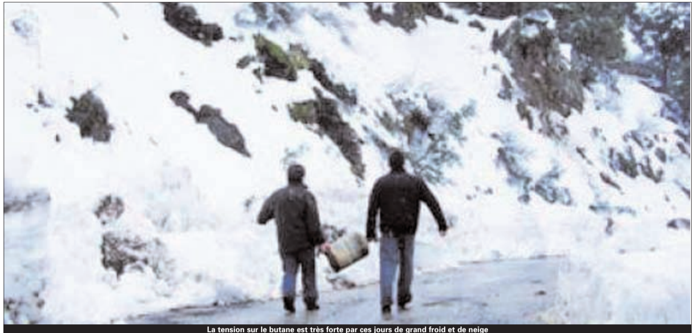
La tension sur le butane est très forte par ces jours de grand froid et de neige

un retard dans le rétablissement du courant électrique