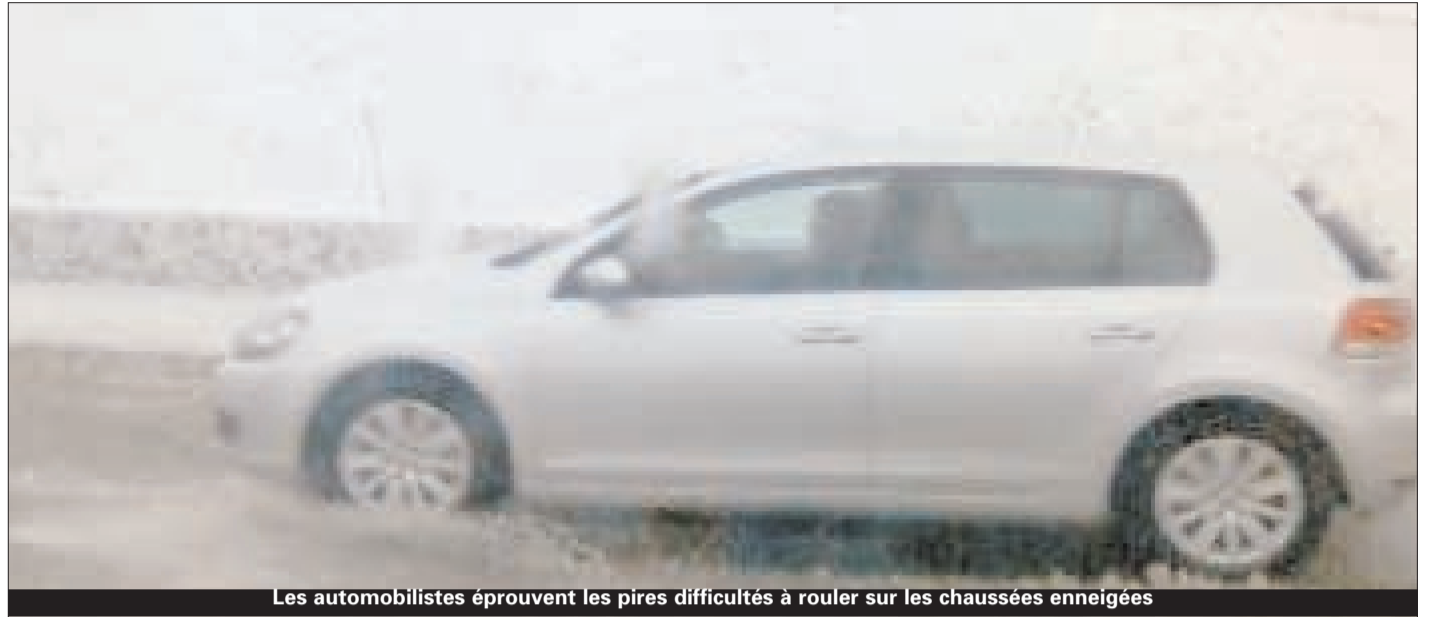
Les automobilistes éprouvent les pires difficultés à rouler sur les chaussées enneigées

La wilaya de Tizi Ouzou est pratiquement paralysée. 8 routes nationales traversant cette wilaya ainsi que 13 autres chemins de wilayas ont été coupés à la circulation. Il s'agit notamment des RN15, 48, 25, 30, 71, 12, 72 et des CW 01, 08, 100, 09, 253, 11, 251, 107, 37, 05, 158, 159 et 150. Le tronçon de l'autoroute Est-Ouest entre Khemis Miliana et El