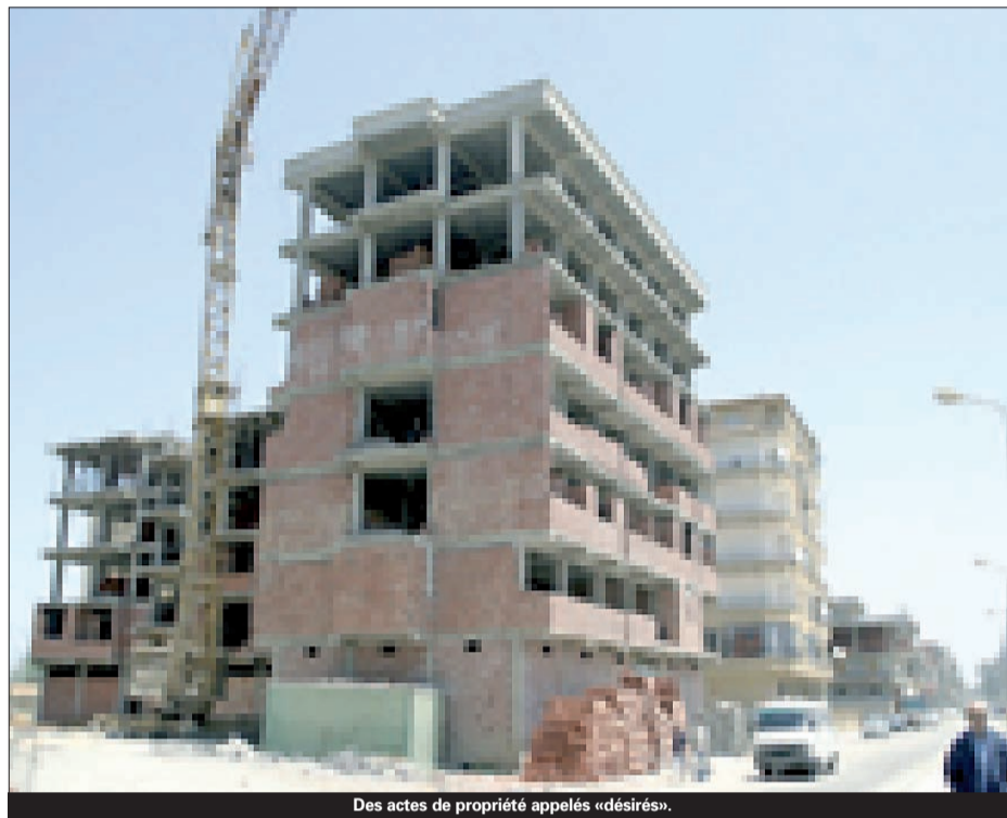
Des actes de propriété appelés «désirés».

Les blocages bureaucratiques de toutes sortes dont se plaignent les citoyens de cet arrière-pays immédiat de la capitale cachent mal les affaires de corruption dont déjà les tribunaux nous ont donné un avant-goût. La problématique du refus de la délivrance des permis de construction par l'administration, n'est pas une affaire nouvelle. Un cas presque similaire a été porté à la connaissance de l'opinion publique en 2007. Des habitants (au nombre de 78) ayant acquis auprès de cette APC un lot de terrain, à titre social, ont