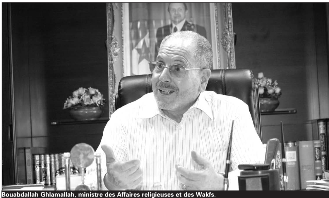
Bouabdallah Ghلامallah, ministre des Affaires religieuses et des Wakfs.

« Il s'est avéré que le plan de charge assigné à l'Onat et au TCA dépasse largement leurs moyens limités », a déclaré Bouabdallah Ghلامallah, hier, sur les ondes de la Chaîne III de la Radio nationale. En effet, les