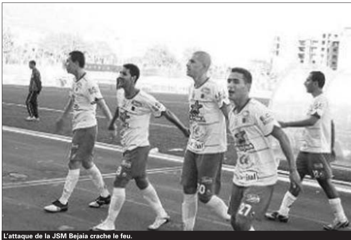
L'attaque de la JSM Bejaia crache le feu.

Une minute ne s'était pas écoulée que la formation locale a trouvé le chemin des filets de son adversaire grâce à une belle tête de Gasmî. A peine dix minutes seulement du premier but, le même joueur offre le deuxième but à son équipe.