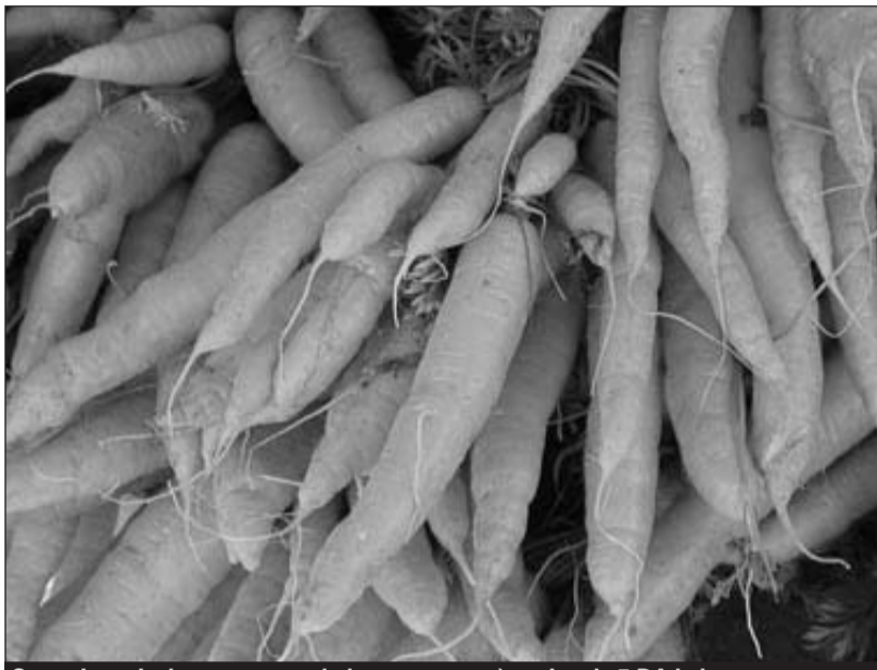
Certains agriculteurs ont vendu leurs carottes à moins de 5 DA le kg.

Cette situation a conduit nombre de producteurs à renoncer à procéder à la récolte pour ne pas subir davan-