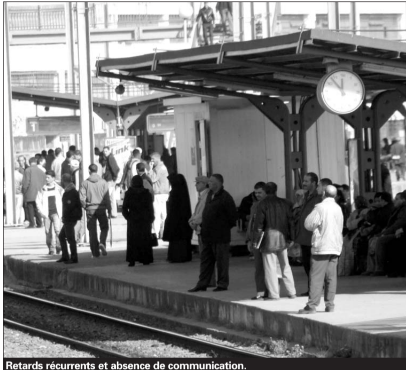
Retards récurrents et absence de communication.

Ces perturbations itératives, touchant les horaires de départ des trains, pénalisent des centaines de voyageurs qui restent bloqués sur les quais n'ayant pas d'autre recours. Jeudi passé a été particulièrement pénible pour les usagers, contraints de faire le pied de grue durant des heures et voyant leurs inquiétude et angoisse grandir au fil des heures d'autant que la nuit s'était déjà installée. En l'absence de communication et d'informations fiables, les rumeurs allaient bon train. certains affirmaient détenir "de sources sûres" qu'un câble électrique aurait été sectionné, par des