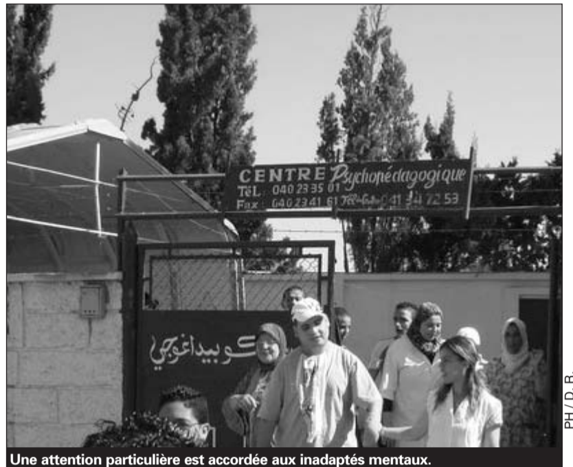
Une attention particulière est accordée aux inadaptés mentaux.

En vertu d'une convention signée pour l'exercice 2010/2011 entre le centre pédagogique des inadaptés mentaux et le centre de formation agricole de Messreghine, des enseignants qualifiés seront appelés à