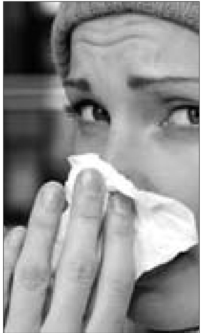
rel est le plus adapté à vos maux.

N'hésitez pas à demander conseil à votre pharmacien pour savoir quel remède natu-