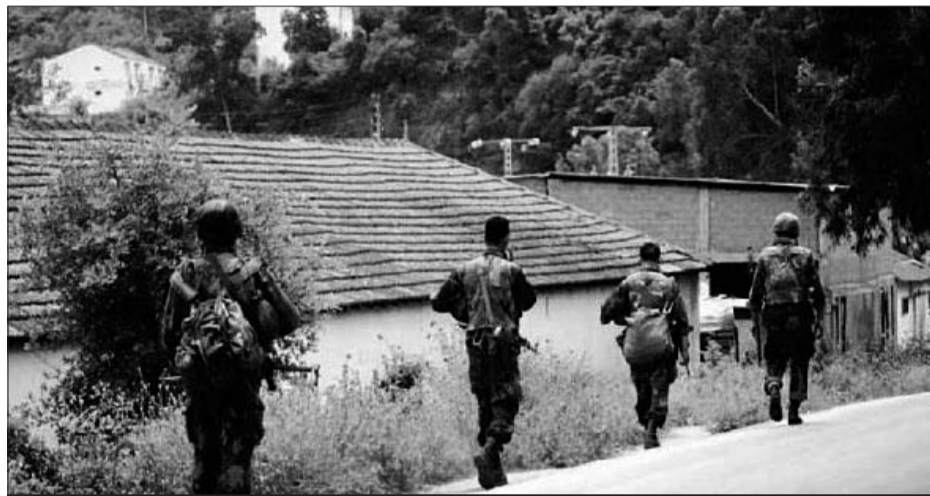
Les ratissages se soldent souvent par des éliminations de terroristes.

Souvent épaulées par les gardes communaux et les patriotes dont l'expérience est avérée dans la lutte antiterroriste, les forces de l'armée ont mené minutieusement plusieurs opérations afin de traquer les hordes terroristes écumant les massifs forestiers de ladite région. En effet, ils ont réussi à éliminer, au début du mois dernier, l'émir de la sérieate Al Khartoum, Ben Nebri Fateh, alias Zeid, dans une opération de ratissage dans la localité d'Ait Ziane sur les hauteurs de Sidi Ali Bounab, près de Timezrite. Cet émir, originaire de Cap Djenet, avait rejoint les rangs du GIA dans le début des années 90 et a fini par rallier les phalanges de l'ex-GSPC activant dans l'angle Zemmouri-Legata-Sidi Daoud. Deux autres terroristes affiliés à la sérieate locale de Sidi Daoud ont été abattus au cours