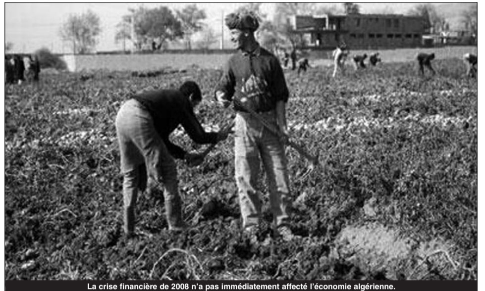
La crise financière de 2008 n'a pas immédiatement affecté l'économie algérienne.