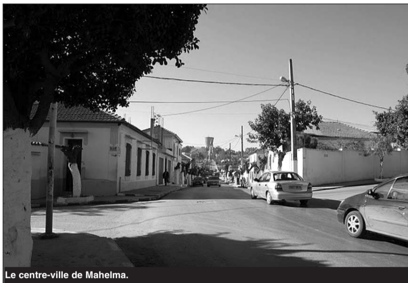
Le centre-ville de Mahelma.