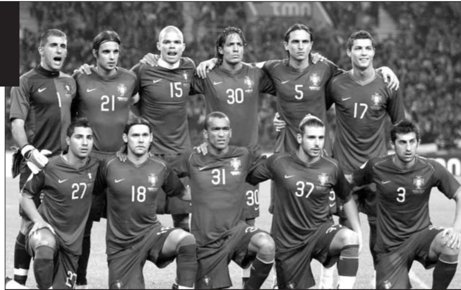
Le Portugal, avec le virevoltant Cristiano Ronaldo en attaque, ne manque pas d'arguments en défense.

Carlos Queiroz restera à jamais comme l'homme qui a mené les Luis Figo, Rui Costa et autres Fernando Couto au titre mondial juniors en 1989 et 1991. Pour beaucoup, le technicien portugais peut-être considéré comme le mentor de cette fameuse