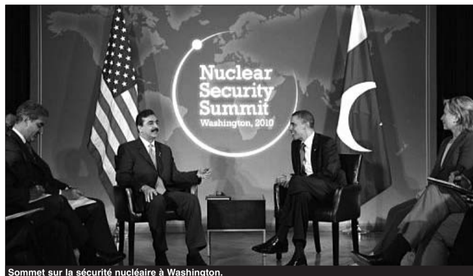
Sommet sur la sécurité nucléaire à Washington.

Après avoir identifié au premier jour du sommet sur la sécurité nucléaire les menaces pesant sur le secteur, le terrorisme nucléaire en étant la principale selon notamment les Etats-Unis et leurs alliés, les participants devaient s'intéresser hier aux mesures concrètes pour sécuriser les stocks de matières fissiles afin d'empêcher les terroristes de s'en emparer.