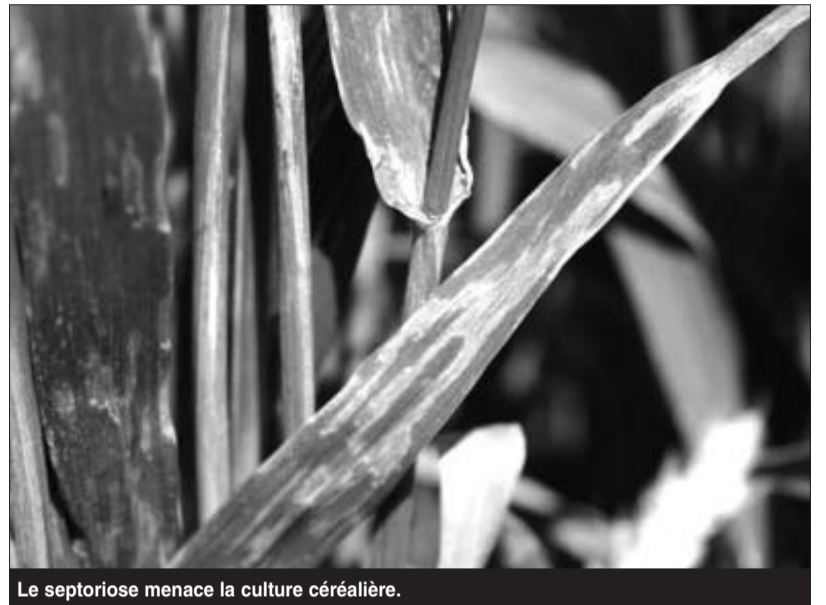
Le septoriose menace la culture céréalière.

Selon la Direction des services agricoles (DSA), quelque 300 hectares de superficies céréalières, sur les 15.359 ha emblavés, ont été touchés par la septoriose à El-Tarf malgré les campagnes de sensibilisation menées par les services concernés. Pour éviter la propagation de cette maladie fongique, ces derniers ont procédé au traitement chimique immédiat de mille ha de céréales et de 224 ha de céréales destinées à la multiplication de semences. Ces foyers de septoriose sont apparus dans les basses plaines emblavées de la région de Dréan et de Besbès où la culture des céréales est "déconseillée", ont indiqué les services de la DSA, ajoutant que dans ces zones, cette maladie, "pouvant engendrer des dégâts importants", est essentiellement due à la stagna-