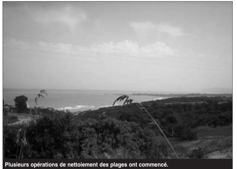
Plusieurs opérations de nettoyage des plages ont commencé.

Les opérations d'aménagement et de nettoyage des 25 plages autorisées que compte la wilaya de Boumerdès ont été lancées en guise de préparation de la saison estivale 2010. Selon la Directrice du tourisme, il s'agit, entre autres, de la réalisation de travaux d'aménagement consistant, notamment, en la création de postes de la Protection civile et de la Gendarmerie nationale, outre l'équipement de ces plages en douches, eau potable et sanitaires. Parallèlement, il sera procédé à l'aménagement d'accès vers ces plages, qui seront, également, équipées de panneaux de signalisation et d'information ainsi qu'à la réhabilitation de l'éclairage public. Selon cette responsable, son département a affecté un programme sectoriel spécial pour l'étude et l'aménagement de huit plages dans les communes de Boumerdès, Corso, Thénia,