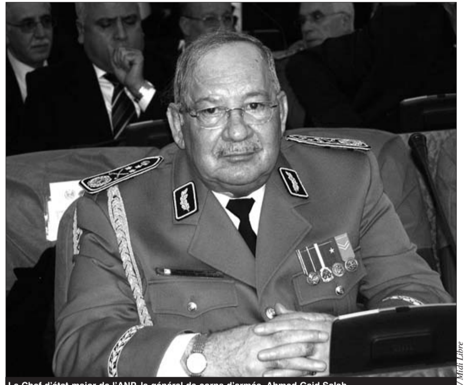
Le Chef d'état-major de l'ANP, le général de corps d'armée, Ahmed Gaid Salah.

Cette seconde réunion de haut niveau après celle des ministres des AE de Mauritanie, du Mali, du Niger, du Burkina Faso, de Libye, du Tchad en plus du pays hôte, se veut une réponse sans ambages contre l'ingérence étrangère dans la région du Sahel. «Notre réunion a pour objet central, la lutte contre le terrorisme transnational, la criminalité organisée et les phénomènes connexes (...) une opportunité d'échanger les analyses sur ces menaces qui, faute d'actions collectives et synchrones pour les dissuader et les éliminer, ouvrirait la porte aux interventions étrangères», a clairement souligné le général Gaid Salah, à l'ouverture des travaux de la réunion des chefs d'état-major des pays sahélo-sahariens, tout en insistant sur la «co-responsabilité» des Etats concernés pour relever ce défi. Il a appelé dans ce sens à identifier les voies et moyens de résoudre les problèmes de sécurité par la définition et la matérialisation d'un modèle de coopération militaire approprié, avec la conviction que «nous pouvons assumer la pleine responsabilité de cette ambition légi-