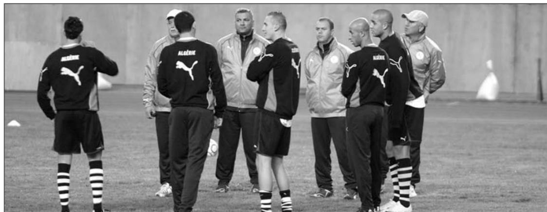
Le staff technique de l'équipe nationale prodiguant des conseils aux joueurs pendant une séance d'entraînement.

Nous disposons tous de la qualité nécessaire et j'espère que nous parviendrons à tirer notre épingle du jeu.