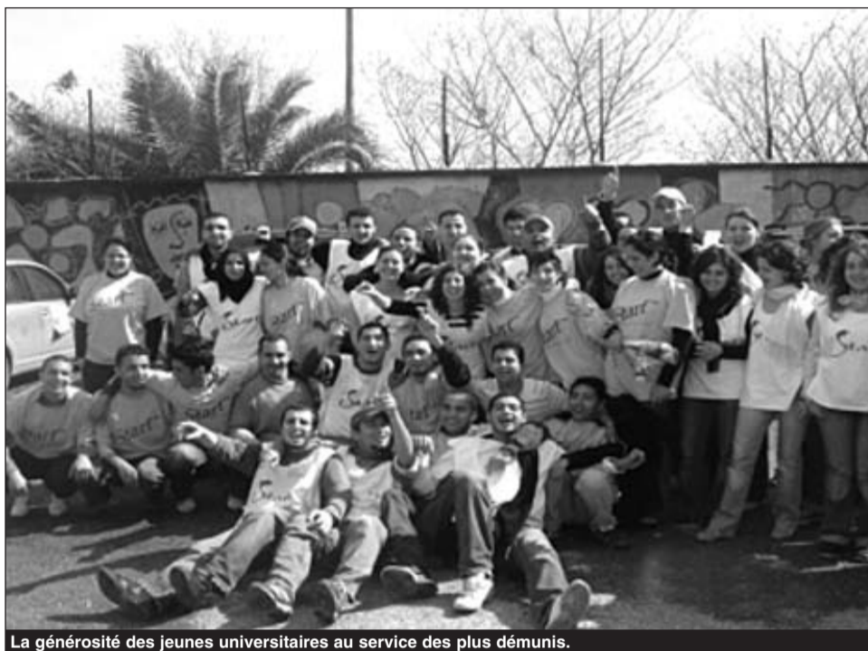
La générosité des jeunes universitaires au service des plus démunis.

Cette association de jeunes croit tellement en les capacités d'un être humain parce que, explique-t-on «nul homme n'est une île et parce que nous croyons profon-