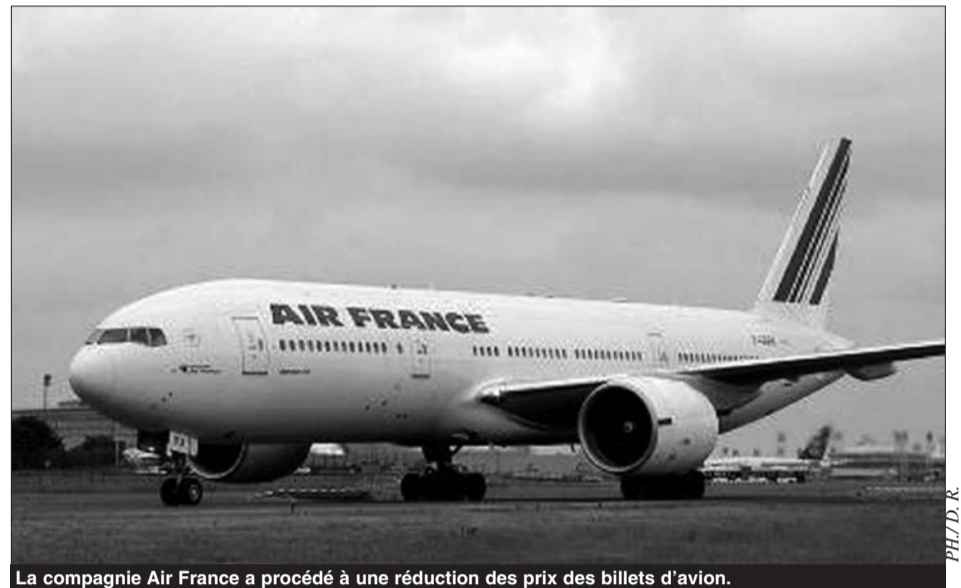
La compagnie Air France a procédé à une réduction des prix des billets d'avion.

La compagnie offre au voyageur Premium un accès à tous les salons des aéroports, une zone d'enregistrement exclusive, file prioritaire d'embarquement, une restauration modernisée et un siège plus large et d'une place libre à ses côtés.