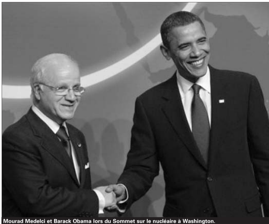
Mourad Medelci et Barack Obama lors du Sommet sur le nucléaire à Washington.

«La protection des installations et matières nucléaires civiles est conçue par mon pays comme un processus en quête permanente d'amélioration et de renforcement», a-t-il affirmé. L'Algérie, a-t-il rappelé, a adopté, dans ce cadre, nombre de mesures d'ordre législatifs, réglementaire et pratique. Il citera, à ce titre, la ratification de la Convention sur la protection physique des installations et matières nucléaires déposée auprès de l'AIEA, telle qu'amendée par la Conférence des Etats parties en juillet 2005, l'adhésion à la résolution 1540 du Conseil de sécurité de l'ONU et la présentation de rapports périodiques et réguliers sur sa mise en oeuvre au plan national. Medelci a, également, cité le renforcement du dispositif réglementaire en matière de contrôle des sources radioactives, notamment pour ce qui est de la détention, l'utilisation et l'importation de ces sources ainsi que l'adoption d'un programme pour la sécurisation des sources radioactives de haute activité, en coopération avec l'AIEA. Le ministre a annoncé, de ce fait, qu'un projet de loi sur la sécurité nucléaire est actuellement en