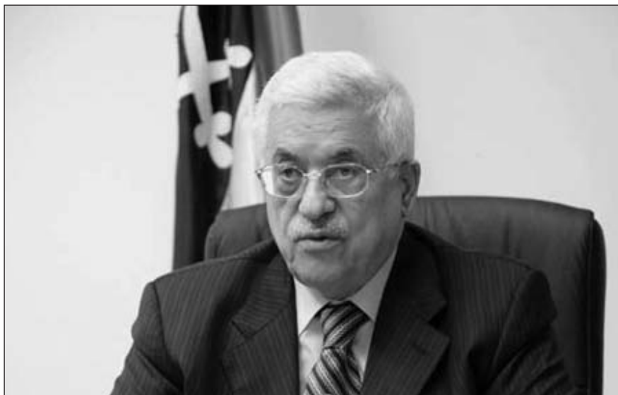
Le président palestinien, Mahmoud Abbas.

Il a indiqué que le président palestinien allait réclamer une réunion du