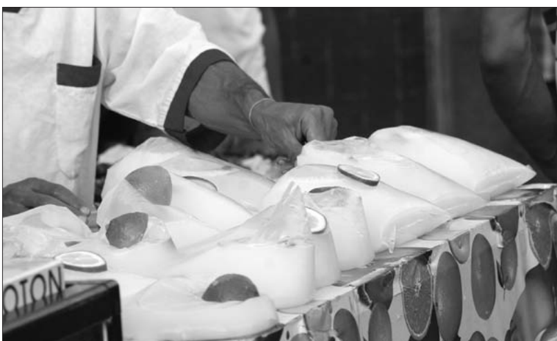
Un produit faisant partie des us et coutumes du mois sacré.

Les Algérois ne peuvent concevoir un ramadhan sans la zlabia, beaucoup vous diront que la meilleure zlabia est celle de Boufarik. Cette petite localité située à 35 km au sud-ouest d'Alger a eu ainsi ses lettres de noblesse grâce à ce gâteau mielleux mais aussi et surtout grâce à sa «cherbat». Cette boisson préparée à base de citrons, est très demandée en ce mois de ramadhan pour ses qualités rafraîchissantes. Canicule du mois d'août oblige, la consommation de cette boisson s'est intensifiée durant le ramadhan de cette année. La cherbat tradi-