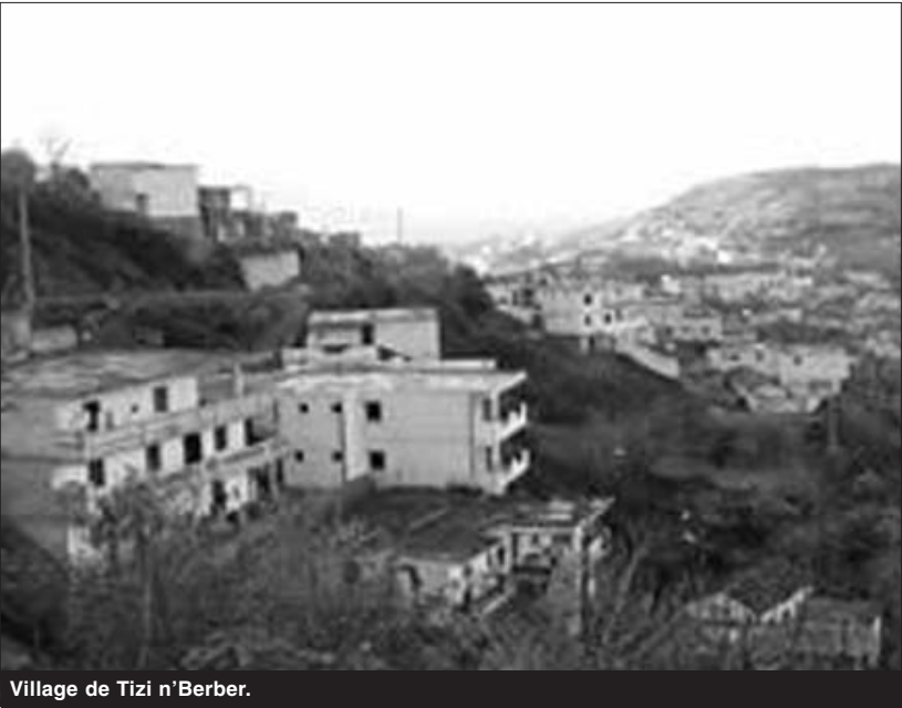
Village de Tizi n'Berber.

Bien que disposant de potentialités, tant humaines que naturelles importantes, lui permettant de se prendre un tant soit peu en charge, la commune de Tizi n'Berber accuse un retard en matière d'infrastructures. En l'absence d'entités génératrices de postes d'emploi, le chômage bat son plein, d'où la baisse du niveau de vie. Des jeunes, constituant la majorité écrasante de la population, sont livrés à eux mêmes en attendant que les pouvoirs publics agissent contre le chômage. Non seulement ses richesses ne sont pas exploitées, mais il existe un grand déficit en matière d'infrastructures de base et les budgets pour les projets proviennent au compte- gouttes. Cette commune issue du découpage admi-