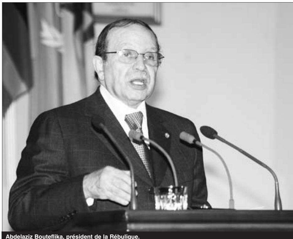
Abdelaziz Bouteflika, président de la République.

Le président de la République, Abdelaziz Bouteflika, a souligné lors de la réunion consacrée à l'évaluation consacrée au secteur de l'agriculture et du développement rural, qu'il a présidé, la nécessité de «relever le défi de la sécurité alimentaire». L'exposé du ministre de l'Agriculture a porté sur les résultats de l'année 2009 et la projection du Programme quinquennal 2010-2014. Le chef de l'Etat a saisi cette occasion pour charger «le gouvernement de consolider un ensemble de mesures destinées à concourir au renouveau agricole dont la finalisation du dispositif juridique encadrant l'exploitation des terres du domaine privé de l'Etat, avec la loi sur la concession agricole qui devra compléter la loi d'orientation agricole, stabiliser l'exploitation du foncier agricole propriété de l'Etat, et sécuriser l'agriculteur dans le cadre d'une concession claire». Abdelaziz Bouteflika a rappelé les importantes mesures, arrêtées en février dernier, au bénéfice de ce secteur, qu'il s'agisse de l'effacement de la dette des éleveurs pour plus de 40 milliards DA ou qu'il s'agisse de multiples encouragements à la production agricole et à l'élevage, d'un coût annuel de 200 milliards DA. Ces mesures se sont traduites, selon Abdelaziz Bouteflika, par les bons résultats des moissons de cette année qui prouvent que