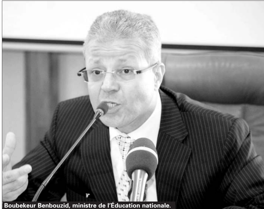
Boubekeur Benbouzid, ministre de l'Éducation nationale.

De son côté, le gouvernement a volé au secours du département de l'éducation en lui consentant un programme de plus de 4.000 logements destinés aux ensei-