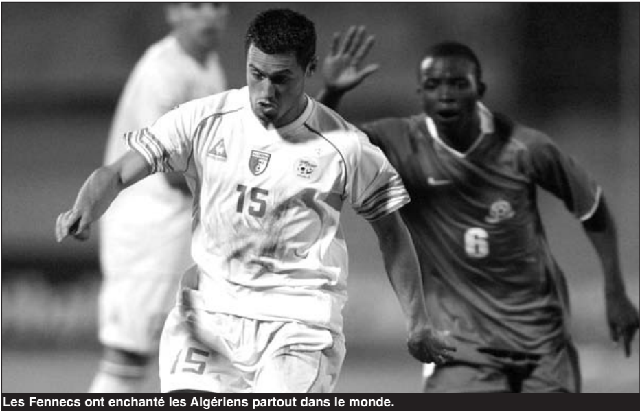
Les Fennecs ont enchanté les Algériens partout dans le monde.

Jamais le drapeau algérien n'a autant été aussi brandi dans les rues parisiennes que cette nuit là. Une liesse indescriptible. Fait tout aussi inédit, les jeunes supporters scandent les noms de Madjer et Belloumi faisant référence au mondial de 82 et la fameuse