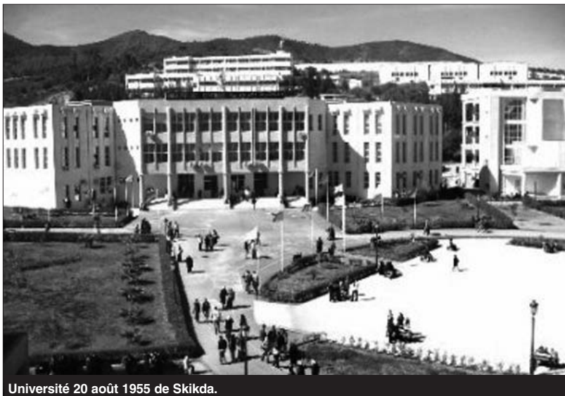
Université 20 août 1955 de Skikda.

Ces infrastructures, en sus de celles existantes, permettront d'ac-