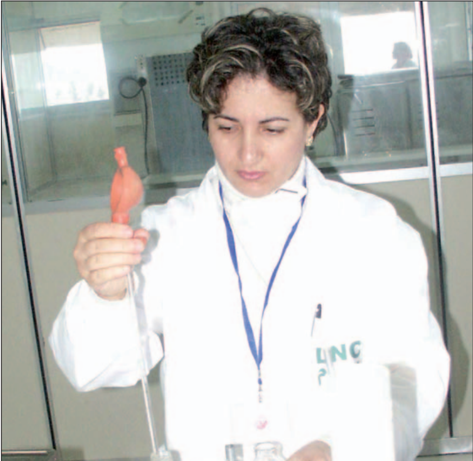
Le virus A/H1N1 a déjà coûté la vie à 2.837 personnes de le monde.

De crainte d'une pandémie, surtout avec la rentrée sociale et scolaire, le ministère de l'Education nationale, en collaboration avec le ministère de la Santé, a mis en place un plan d'actions «opérationnel» en cas de fermeture des établissements scolaires pour cause de pandémie de grippe A (H1N1). Ce plan s'articule en deux phases : une première préventive et de sensibilisation au profit des élèves et une seconde consistant en des mesures