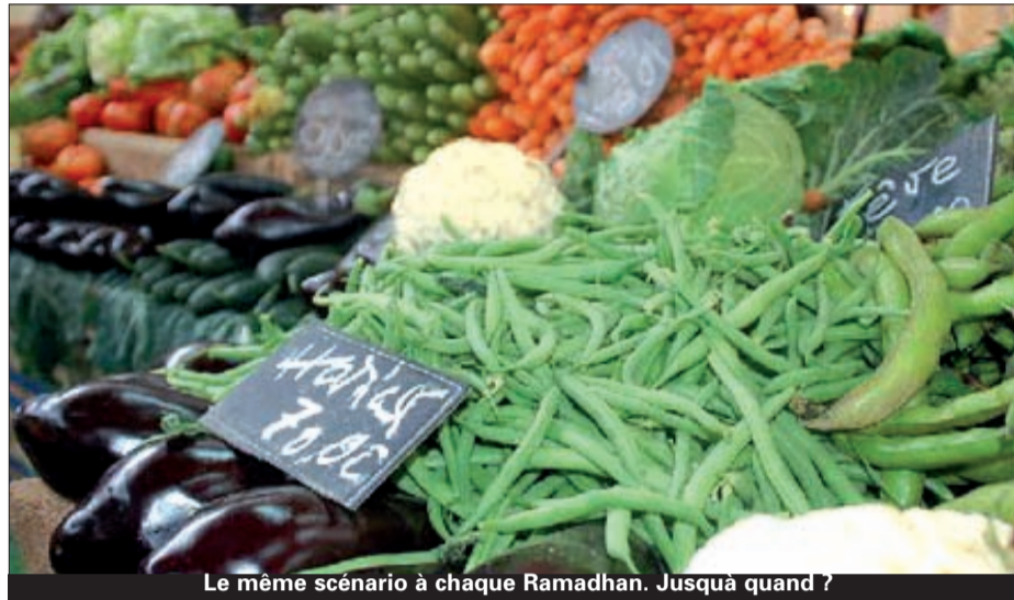
Le même scénario à chaque Ramadhan. Jusqu'à quand ?

Le contrôle sur les prix et la qualité sera renforcé et la disponibilité des produits alimentaires de large consommation devraient, selon le ministre du Commerce et ses collaborateurs, « stabiliser » les prix à un seuil abordable pour les ménages. Les propos de ces responsables débordaient-ils d'optimisme ou espéraient-ils vraiment à ce que les marchands joueraient le jeu de l'offre et de la demande, règle immuable du marché libre. La veille du premier jour de Ramadhan, la mercuriale commençait à chauffer, malgré une offre abondante en produits frais et légumes secs. Viandes rouges et blanches, produits agricoles frais et légumes secs affichaient de nouveaux prix la veille du début du mois sacré. Les spéculateurs tâtaient les pouls et les réactions des ménages. Le rush des clients sur tous les produits exposés sur les étals des commerces, le jeudi, était un signe qui encourageait les commerçants à tirer encore plus les prix vers le haut. La razzia opérée ce jour là était le blanc-seing qu'attendaient les marchands pour imposer leur diktat à un marché qui n'obéissait à aucune règle. Vendredi, premier jour de Ramadhan, Le kilogramme de viande ovine est cédé à pas moins de 1 200, voir 1 300 DA dans certains marchés de la capitale. Le poulet à 350 et jusqu'à 390 DA vers les coups de 11h alors que les pois chiches se négociaient à près de 300 DA. Le coup de pub de l'OAIC qui invitait les commerçants à s'approvisionner chez lui