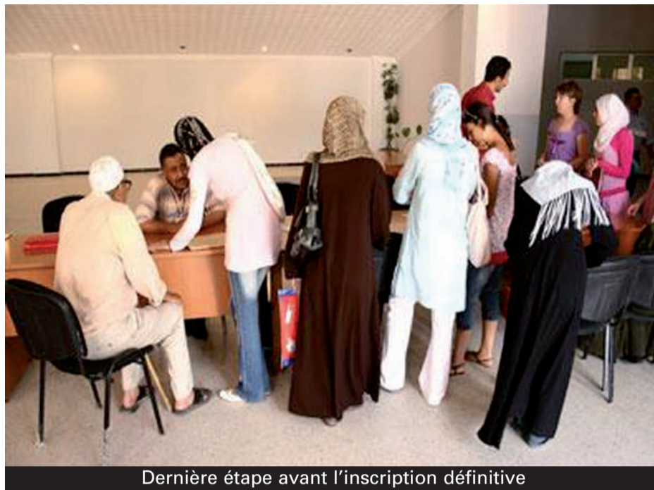
Dernière étape avant l'inscription définitive

Et c'est demain et après-demain aussi que les bacheliers non-satisfaits de leur orientation peuvent introduire des recours auprès des services concernés. Mais cette année, les responsables du secteur de l'Enseignement supérieur ont insisté sur le fait que le recours ne sera accepté que dans le cas où aucun des dix choix introduits par le