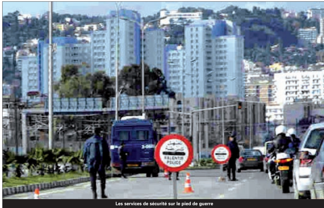
Les services de sécurité sur le pied de guerre