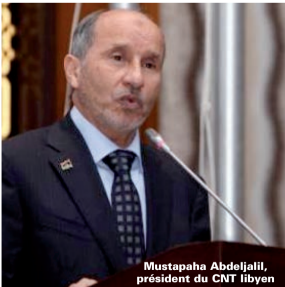
Mustapha Abdeljalil, président du CNT libyen

Le ministre libyen du Travail et de la Formation professionnelle, M. Mustapha Ali Radjbani, a mis en avant, mardi, "l'amorce d'un contexte de relance et de promotion des relations algéro-libyennes pour qu'elles suivent naturellement leur cours". "L'étape de relance et de promotion des bonnes relations bilatérales a été amorcée à travers les rencontres qui ont regroupé ces derniers mois, à Doha et à Tunis, le président de la République, M. Abdelaziz Bouteflika, et le président du Conseil national de transition (CNT), M. Mustapha Abdeldjalil", a souligné M. Ali Radjbani dans une déclaration à l'APS. Dans ce contexte, le ministre