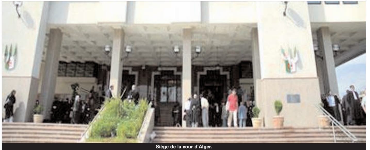
Siège de la cour d'Alger.

Le contrat comporte, selon la même source, des termes portant préjudice aux intérêts d'Enapal et contraires à la réglementation en vigueur en matière de circulation de fonds.