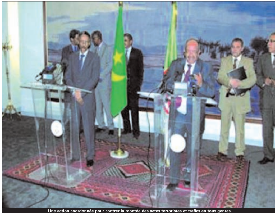
Une action coordonnée pour contrer la montée des actes terroristes et trafics en tous genres.

C'est le résultat tangible de la rencontre de Nouakchott qui a réuni pendant deux jours, les ministres des Affaires étrangères des pays du Sahel. Le comité politique aura pour mission la planification du suivi et de la mise en œuvre de toutes les actions des ministres des Affaires étrangères des quatre pays, a souligné Abdelkader Messahel lors d'une