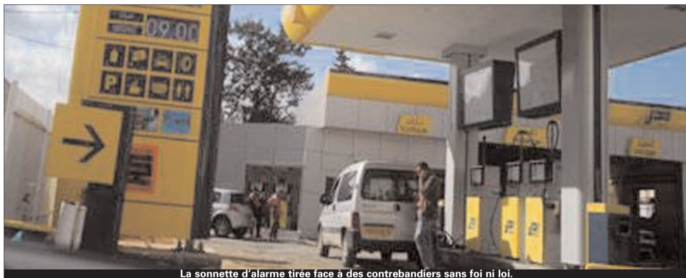
La sonnette d'alarme tirée face à des contrebandiers sans foi ni loi.

Un moment donné et ce, au plus fort de la guerre civile libyenne, ce sont les régions frontalières avec la Libye qui avaient davantage attiré l'attention. Des réseaux de contrebande de l'essence se sont alors constitués à l'effet d'acheminer ce produit vers ce pays pétrolier qui n'avait jamais, du reste, connu pareille situation dans son histoire. On a vu alors de graves pénuries de carburant affecter la région de l'Est algérien causant des files interminables devant les stations-service. Mais pour Tlemcen et la frontière Ouest, l'année 2011 s'est avérée aussi comme l'année où l'on a enregistré