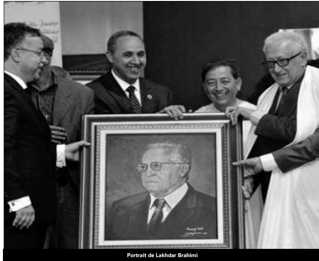
Portrait de Lakhdar Brahimi