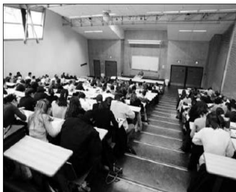
ences de la nature et de la vie, de technologie et des sciences humaines.