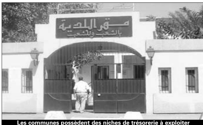
Les communes possèdent des niches de trésorerie à exploiter

Près de 1200 communes en Algérie sont dans un état chaotique du point de vue financier. Elles ne peuvent plus assurer les équilibres tant souhaités ni entreprendre les projets qui sont tout bonnement mis en berne. Une note du ministère de l'Intérieur estime que « les communes ont recours systématiquement au fonds commun des collectivités locales pour assurer leurs budgets » mais cela ne couvre qu'une infime partie des régions dont les besoins sont beaucoup importants. Il ressort ainsi que seule les recettes fiscales de la commune peuvent sauver un tant soit peu la situation qualifiée par certains experts de désastreuse. En effet, les