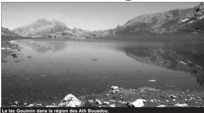
Le lac Goulmim dans la région des Ath Bouadou.

Pour d'autres, Ath Bouadou signifierait « ceux du vent », « Ath Bou Adu », d'ailleurs la région est toujours balayée par des vents violents. La troisième version, quant à elle, rattache cette dénomination à un marabout qui portait le nom de Bouadou.