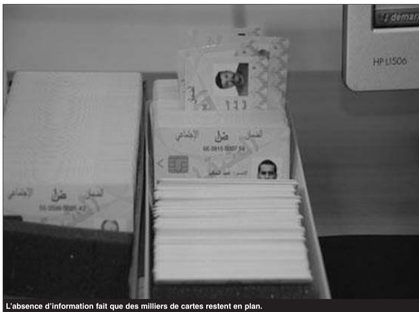
L'absence d'information fait que des milliers de cartes restent en plan.

Selon notre interlocuteur au niveau de la CNAS, les malades chroniques et les retraités ont été prioritaires dans ce programme. D'ailleurs, rien que pour