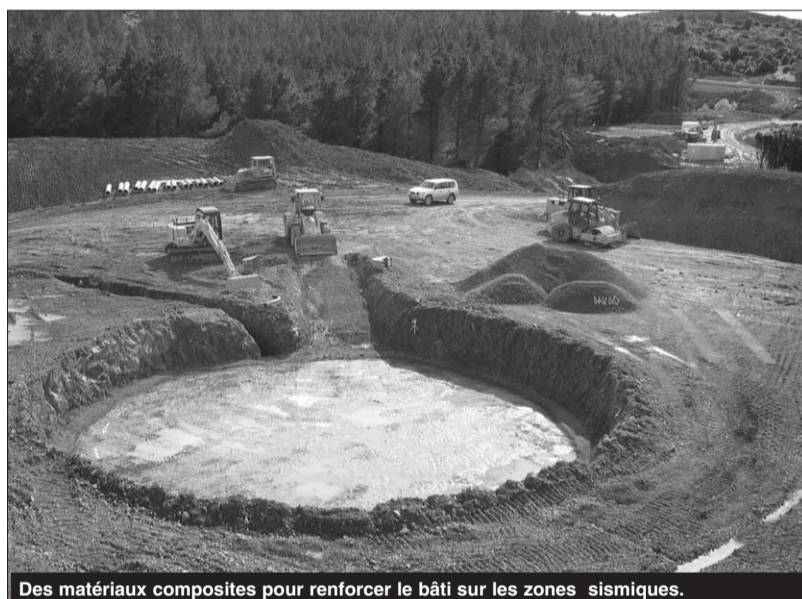
Des matériaux composites pour renforcer le bâti sur les zones sismiques.

pièces (couples cinématiques, chaînes,...) qui sont fabriqués avec des alliages ferreux devant résister à l'usure. « De ce fait et pour une bonne robustesse, nous avons pensé pour remédier à un ensemble de problèmes, de prévoir pour les pièces d'usure des matériaux ayant des caractéristiques mécaniques de hautes résistances et des traitements thermiques » avait-elle conclu.