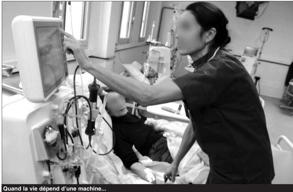
Quand la vie dépend d'une machine...

«Devant cette situation dramatique que vit l'insuffisant rénal en Algérie et en particulier à Guelma, nous avons décidé, des confrères et consœurs et moi, de créer une association, ne serait-ce qu'avec nos propres moyens pour apporter de l'aide à cette fran-