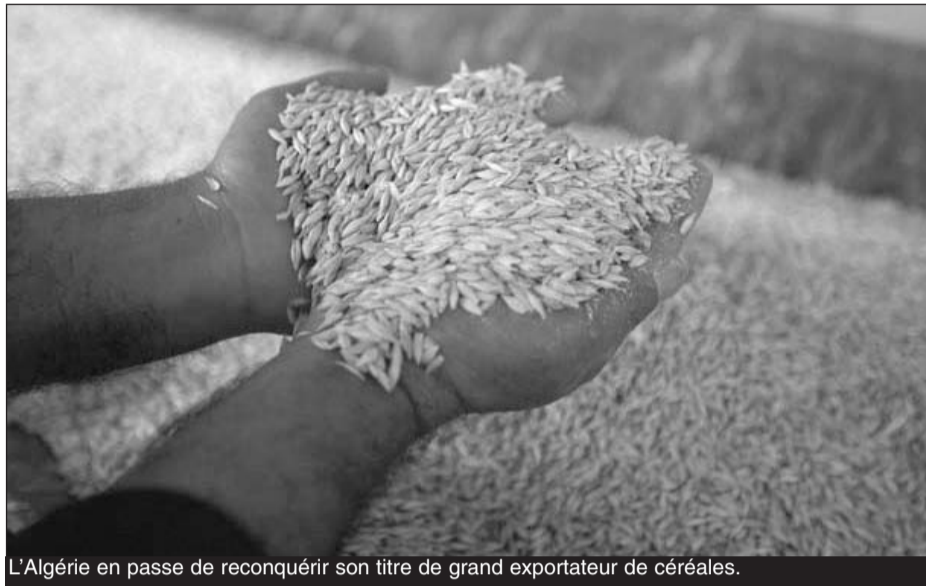
L'Algérie en passe de reconquérir son titre de grand exportateur de céréales.

L'exportation, lundi dernier, par l'Algérie de 100 mille quintaux d'orge est à marquer d'une pierre blanche pour le secteur de l'agriculture. Près de 43 ans après avoir effectué sa dernière exportation de 50 mille quintaux de blé dur, notre pays renoue avec la tradition qui était depuis toujours la sienne, l'exportation des produits agricoles «C'est le début d'un processus inverse», a lancé fièrement samedi dernier, lors de l'embarquement de la marchandise, le ministre de l'Agriculture et du Développement rural, Rachid Benaïssa. Cette opération est particulière pour le pays qui pourrait rejoindre à terme «le club fermé» des pays exportateurs de céréales après en avoir été, pendant longtemps, l'un des plus gros clients. Plusieurs éléments ont concouru à réaliser cette performance, notamment une production céréalière record de 61,2 millions de quintaux durant la saison 2008-2009. Cette production couvre totalement nos besoins en blé dur, et qui plus est, dégage un excédent en orge. L'Algérie s'attend à engranger également cette année une récolte