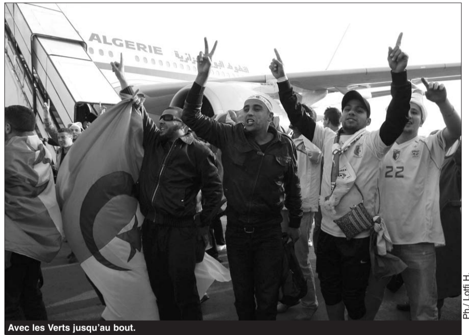
Avec les Verts jusqu'au bout.