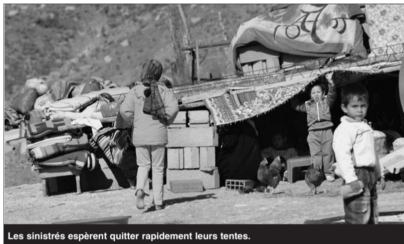
Les sinistrés espèrent quitter rapidement leurs tentes.

L'équipe d'expertise du CTC ont fait état de plusieurs fissures et effondrements dans différents établissements scolaires, de santé, culturels et administratifs dans les deux communes voisines ; au total onze mosquées, dont cinq à Ouenougha, quatre collèges d'enseignement moyen CEM, neuf écoles primaires, le centre culturel de Beni Ilman, partiellement effondré et les deux autres dans la commune de Ouenougha ainsi que les deux bibliothèques communales des deux localités qui ne sont plus opérationnelles et les sièges administratifs communaux et plusieurs équipements publics des deux localités. Il est à noter aussi que plusieurs infrastructures sanitaires ont été endommagées et ne peuvent même