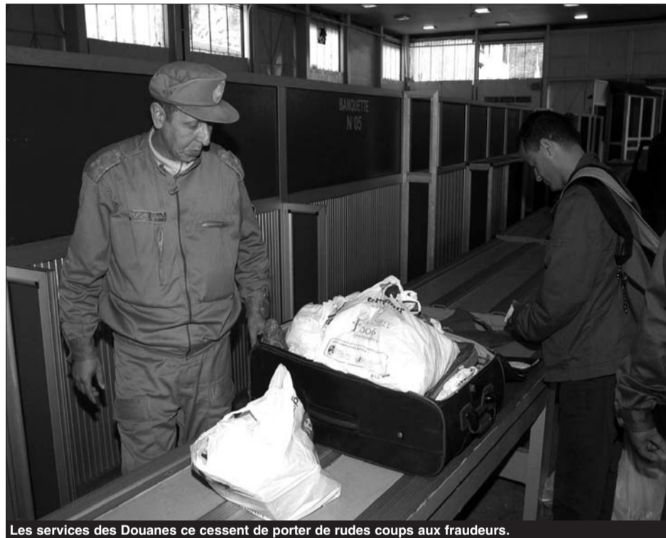
Les services des Douanes cessent de porter de rudes coups aux fraudeurs.

Aussi, d'autres infractions de moindre ampleur ont été également enregistrées à Ouargla (29 infractions, 909,9 millions DA), Annaba (également 29 infractions, 544,5 millions DA), Bechar (10 infractions, 29,3 millions DA), Tébessa (8 infractions, 64,1 millions DA), et Illizi avec 7 infractions pour 16,6 millions DA, ajoute le même responsable. Les infractions constatées portent essentiellement