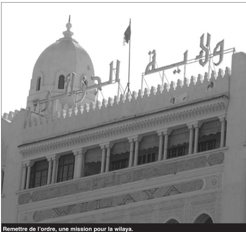
Remettre de l'ordre, une mission pour la wilaya.

L'autre grave problème qui voit le jour au sein de certaines de ces