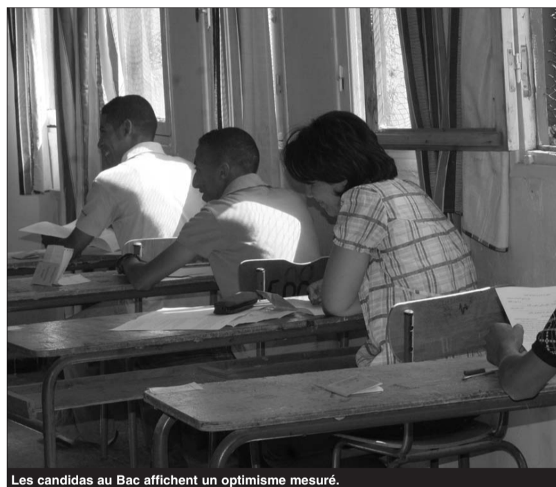
Les candidats au Bac affichent un optimisme mesuré.

Notons que la Direction de l'éducation a mobilisé pour cet examen 20 centres d'examen répartis à travers les sept daïras de la