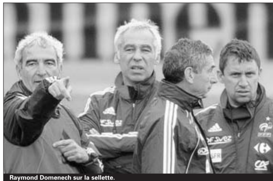
Raymond Domenech sur la sellette.

Jérémy Toulalan est toujours aussi généreux et combatif mais il commet d'étonnantes erreurs techniques pour un joueur de ce calibre. Son rôle de sentinelle devant la défense est primordial dans la tactique Bleue et l'on attend de sa part plus de garanties. A ses côtés, Florent Malouda et Yoann Gourcuff. Le premier est une des rares satisfactions des matchs de prépara-