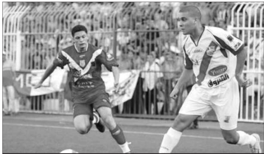
Les Oranais continueront-ils sur leur lancée?