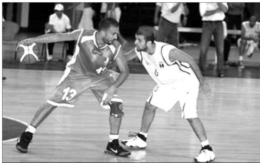
Une journée difficile pour les leaders.

La partie ne manquera pas de piment entre ces deux constantes du basket-ball national. Chaud débat en