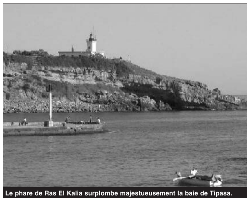
Le phare de Ras El Kalia surplombe majestueusement la baie de Tipasa.

Les travaux entamés au niveau du phare de Tipasa restent toujours inachevés et ce, malgré les directives de M. le ministre des Travaux publics qui avait insisté, à maintes reprises, sur la mise en valeur de ce monument dans le cadre du développement des activités touristiques. Le phare de Ras El-Kalia a été construit en 1867 au nord-ouest du port du chef-lieu de la wilaya de Tipasa sur une haute colline, surplombant ainsi tout le tissu urbain de la ville. Ce monument d'une valeur inestimable témoigne du passé glorieux de cette région du bassin méditerranéen et peut constituer un atout non négligeable dans le développement du tourisme dans la région. Sentinelle