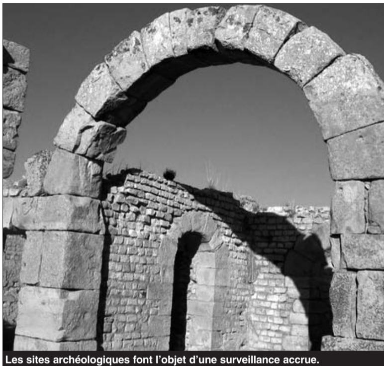
Les sites archéologiques font l'objet d'une surveillance accrue.

Auparavant, elle a annoncé le recrutement de deux chercheurs sur les sites de Khemissa et de Madaure (M'daourouch) pour l'observation continue de la situation des vestiges. Dix postes permanents de gardiennage ont été accordés à Madaure, huit autres pour la ville de Khemissa en plus d'un poste pour chacun des sites de Taoura et Tifache. Selon la directrice de l'OGIPEC, le renforcement en personnels de gardiennage des sites de Madaure et de Khemissa est motivé par l'importance de ces vestiges qui reçoivent un grand nombre de visiteurs nationaux et étrangers. Madaure, classée patrimoine national depuis 1968, est la ville natale de Saint-Augustin, considéré comme l'un des plus grands théologiens du catholicisme. Ses vestiges datant de l'époque romaine, estimés comme les plus importants dans la wilaya de Souk