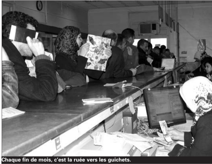
Chaque fin de mois, c'est la ruée vers les guichets.