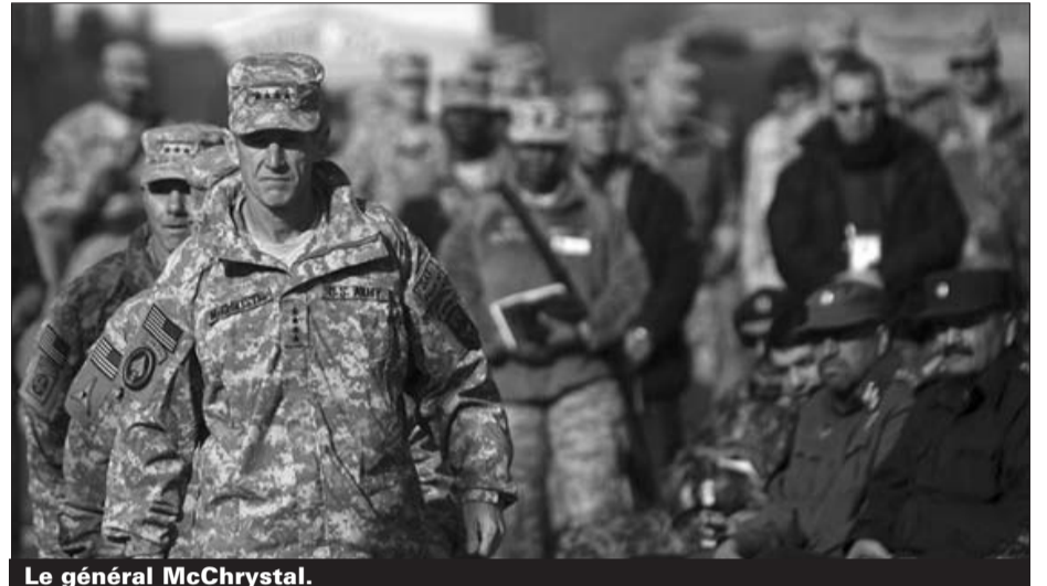
Le général McChrystal.

Elle est aussi de plus en plus meurtrière, l'année 2008 a enregistré le plus grand nombre de soldats tués, et couteuse. Ces renforts couteront 30 milliards de dollars supplémentaires aux contribuables alors que le déficit budgétaire atteint le chiffre record