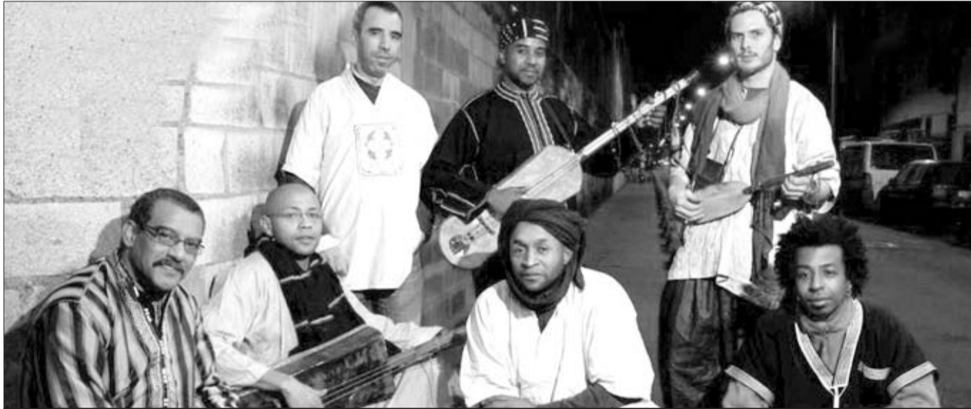
La troupe de musique gnawie Bania

Comme tous les autres centres culturels présents dans la capitale française, le CCA va participer à la manifestation « Sublimons les frontières » organisée par le FICEP (Forum des instituts culturels étrangers à Paris) du 26 septembre au 4 octobre prochain à Paris. Les œuvres de l'artiste peintre Otmane Mersali et la troupe de musique gnawie Bania ont été choisis pour être nos ambassadeurs pour 2009.