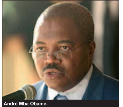
André Mba Obame.

ces derniers se livrent à une guerre d'intoxication. La première est du fils du président Omar Bongo, Ali Bongo, investi par le Parti démocratique gabonais (P-dg, au pouvoir), la deuxième de l'entourage de l'opposant historique Pierre Mamboundou et la troisième de l'ancien ministre de l'Intérieur André Mba Obame. Aucun chiffre n'a encore été communiqué, ni par la Cénap ni par le ministère de l'Intérieur qui co-organisent les scrutins au Gabon. Les résultats de cette présidentielle à tour unique devraient être publiés mercredi entre 18h00 et minuit heure locale (17h00 et 23h00 GMT).