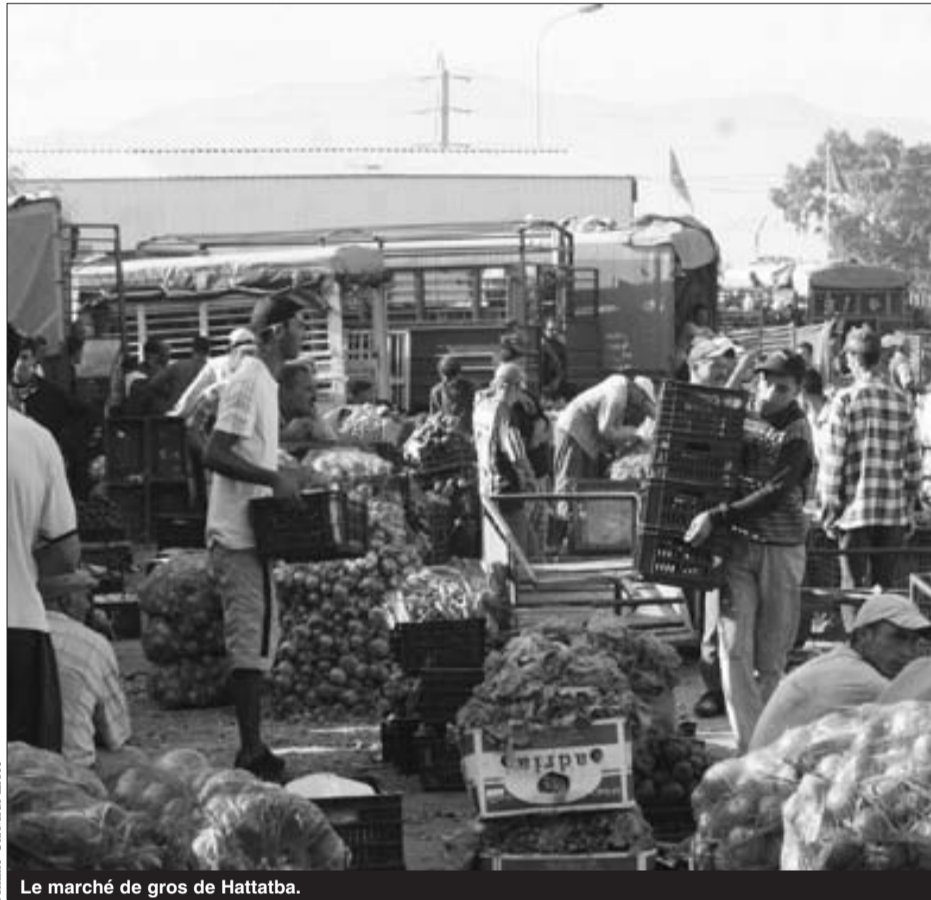
Le marché de gros de Hattatba.

Les prix des produits alimentaires industriels ont, pour leur part, enregistré une légère baisse (0,5%). Quant aux prix des produits manufacturés, ils ont connu une hausse de 2,1% et ceux des services de 6,4%, au cours des sept premiers mois de l'année en cours, détaille l'organisme de statistiques. A l'exception de la baisse des prix des huiles et graisses (-12,3%) et du lait, fromages et dérivés, tous les autres produits du groupe alimentation s'étaient inscrits en hausse au cours des sept premiers mois de 2009 par rapport à la même période de 2008, dont notamment les oeufs (30,3%), les poissons frais (25,7%), la viande ovine (22,3%) et les légumes frais (26,1%). Cette hausse a touché également la viande blanche (poulet) avec 15,4%, la viande bovine (13,3%), les