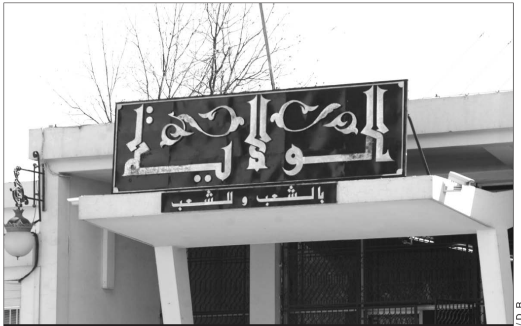
Siège de la wilaya de Khenchla.

Pour faire «avorter» ce projet par tous les moyens, le wali a fait actionner, selon la plaignante, ses propres relais (associations, assemblées élues, ...). Ainsi, elle révèle que le wali a commis des communiqués «non signés» ou alors comportant plusieurs signatures ou cachets d'une même institution et/ou personne, au nom d'élus et d'associations de la société civile. Elle compte d'ailleurs faire valoir ces documents pour les utiliser comme «pièces à conviction» devant le prétoire. «Il a porté atteinte à mon honneur et il doit en répondre», lâche-t-elle rageusement. Cette action en justice qui fera date dans les annales judiciaires, a eu pour conséquence de «brouiller» les cartes du wali qui se retrouve, du coup, «lâché» par ses soutiens à certains