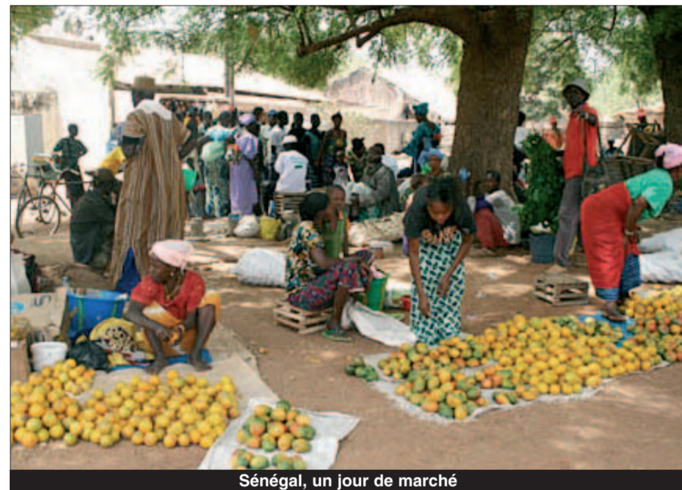
Sénégal, un jour de marché

C'est dire que tout se fait dans l'esprit de la ferveur, se réduit au strict minimum, à la modération et à la privation.