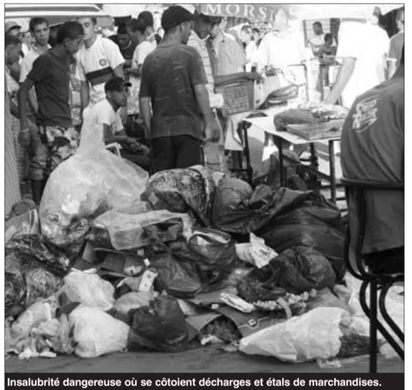
Insalubrité dangereuse où se côtoient décharges et étals de marchandises.

Du côté du marché Daksi, la situation n'est pas plus reluisante.