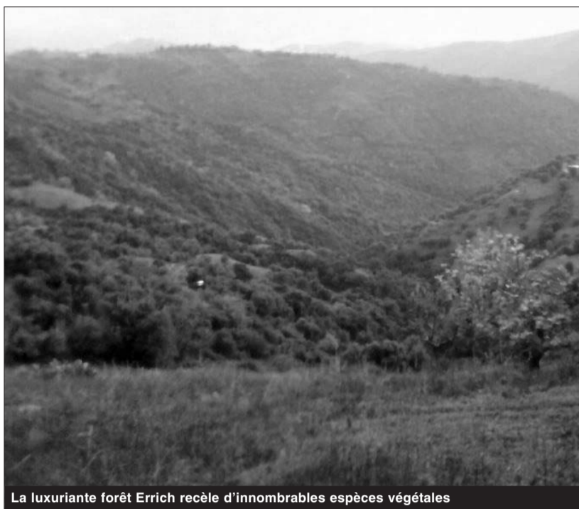
La luxuriante forêt Errich recèle d'innombrables espèces végétales

Après qu'elle fut un repoussoir pendant plus d'une décennie, la forêt Errich, dans un élan de bienvenue, ouvre aux visiteurs les bras de son vaste manteau vert pour un petit mais néanmoins incommensurable moment d'évasion et de bonheur. Pour la wilaya de Bouira, la forêt Errich fait partie de ces nombreuses potentialités qui, pour diverses raisons, ne sont pas encore rationnellement exploitées. Réunissant des atouts non négligeables et différents, ce massif forestiers qui s'étale sur une superficie de 548 hectares (chiffre communiqué par les services de la conservation des forêts), situé au nord et à 06 km du centre-ville, ne bénéficie d'aucune attention à la mesure de son potentiel et de son importance prospective. Zone franche, Errich est un patrimoine à même de favoriser l'urgence d'un pôle d'activité multidisciplinaire à impact certain. Constitué d'un appréciable environnement sylvestre dont les espèces sont composées de plusieurs essences, ce gigantesque poumon est déjà une première forme de villégiature. Véritable coin pour le repos, le pique-nique, le football, équitation et les autres distractions, il est là pour adoucir les journées d'une vie trépidante. Et à Errich contrairement au climat de la ville, de douces brises chargées d'une forte odeur de résine flottent dans l'air. Agréable vague de fraîcheur vivifiante qui rend encore plus féérique un beau tableau fait de longilignes feuilles et résineux