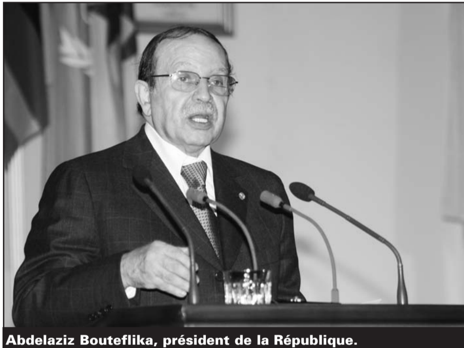
Abdelaziz Bouteflika, président de la République.

fragiles, ont besoin d'être soutenus et consolidés par des actions concrètes». L'Union Africaine et la Communauté internationale «doivent apporter une réponse urgente et appropriée aux attentes des pays qui émergent de conflits, et à leurs populations qui ont un besoin pressant de ressentir et de mesurer les