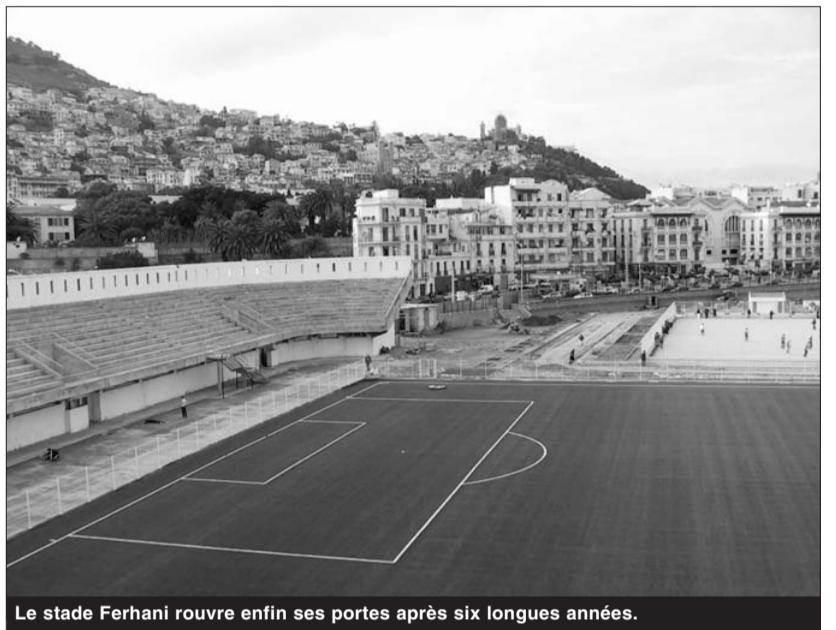
Le stade Ferhani rouvre enfin ses portes après six longues années.

L'enceinte sportive implantée en plein cœur de la commune de Bab El-Oued, à savoir le stade Ferhani-Issad ex-Marcel-Cerdan, a accueilli, enfin, et au grand bonheur de la jeunesse du front de mer algérois, ses tous premiers usagers. C'est lors de la neuvième soirée du mois de ramadhan, que le coup d'envoi d'un tournoi de football pour les «jeunes seniors» a été donné. Une manifestation qui se poursuivra jusqu'au 18 du mois prochain. Après une attente qui aura duré six longues années, les sportifs et amateurs de sports se réjouissent de récupérer enfin cette infrastructures sportive, qui vient ainsi renforcer celles déjà existantes à Alger. Le stade Ferhani a ainsi constitué la pomme de discorde entre trois parties désireuses chacune obtenir la gestion de cette infrastructure : le Mouloudia d'Alger en argumentant qu'il est «honteux pour le doyen des