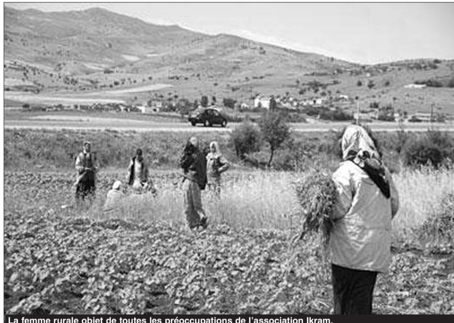
La femme rurale objet de toutes les préoccupations de l'association Ikram.

juillet 2009, l'ONG2 a accordé à l'association Ikram un projet ayant pour titre «Plan de soutien à la femme rurale», le coût total de l'action à atteint les 3.541.356 DA, 80% de ce montant est assuré par l'ONG2 et est versé en tranches, pendant que les 20% restants, soit 2.833.085 DA sont financés, pour ce qui est de ce projet, par le ministère de la Solidarité sociale.