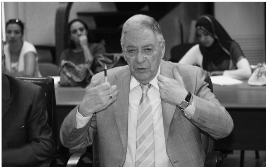
Djamel Ould Abbas, ministre de la Solidarité nationale, de la Famille et de la Communauté nationale à l'étranger.

Lors d'une conférence de presse animée en marge de la cérémonie de signature des conventions de partenariat entre son ministère et les chefs de micro-entreprises chargés de fournir les tabliers et les articles scolaires au profit des familles démunies, le ministre est longuement revenu sur cette question. «Une enveloppe financière de 23,8 milliards DA a été consacrée par l'Etat à cette opération», a-t-il ajouté précisant qu'une enveloppe financière supplémentaire sera allouée chaque année dans le cadre de la loi de finances pour l'exercice 2010. M. Ould Abbas rappelle à cet effet que les personnes concernés sont les personnes licenciées et les familles de terroristes. Il ne manque pas de rappeler dans ce sens que «ces mesures s'inscrivent dans le cadre de la politique de la réconciliation nationale». Par ailleurs et concernant le