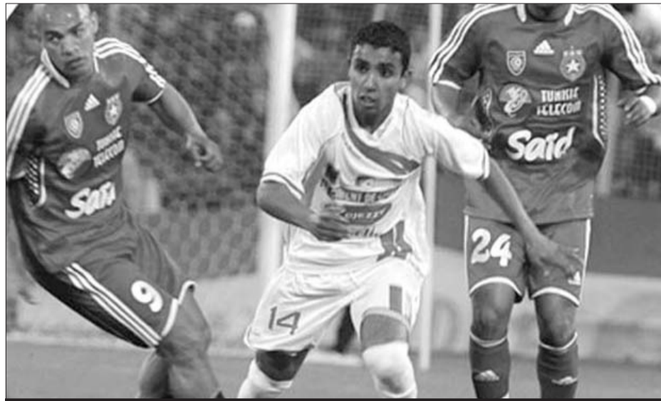
L'ASO paye lourdement les écarts de ses supporters.

Cette rencontre, comptant pour la 4e journée du championnat de Division I, a été marquée par un arrêt de 12 minutes environ au moment où l'équipe visiteuse menait 2 buts à 0. La commission a donné également à l'ASO match perdu par pénalités et une amende de 40.000 DA. La Commission de