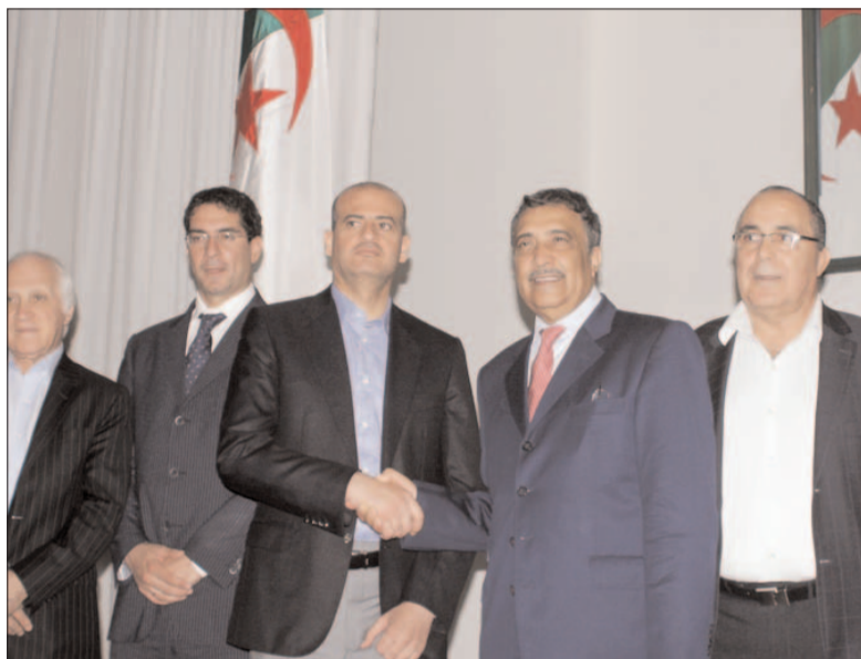
Bilal / Midi Libre

Aussi, plus de 25.000 emplois seront générés par l'exploitation de ce parc, tandis que l'espace résidentiel sera édifié sur une superficie de 3,5 millions de m 2 et les locaux commerciaux sur une surface de 50.000 m 2 . La surface pour le développement du parc se chiffre à 4 millions de m 2 . Quant aux capacités d'accueil de Dounya, elles s'élèvent à 2,5 millions de visiteurs algérien et étranger», a affirmé cet expert. Il estime qu'il s'agit de créer